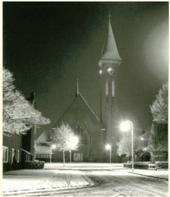
De Heilig Hartkerk aan de Kamerlingh Onnesweg, jaar onbekend; gesloopt in 1991

Klik hier om u af te melden voor deze Nieuwsbrief Nieuwsbrief © 2022 Historische Kring Bussum Contact met de redacteur Realisatie: Fred Hartjes