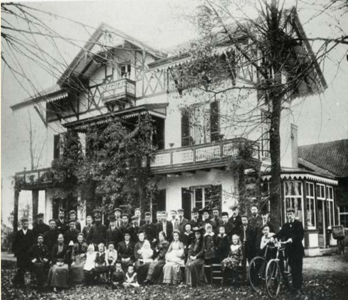
De bevolking van de kolonie Walden voor Villa Cruysbergen aan de Fransekampweg in 1905 (gesloopt in 1968)

Zet alvast in uw nieuwe agenda: Algemene Ledenvergadering, 30 maart 2023, 20.00 uur . Locatie nader te bepalen. Voorafgaand aan het formele deel van de avond verzorgt Eric Bor een lezing over Cruysbergen.