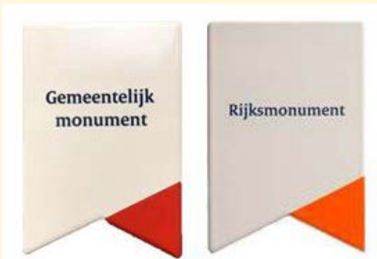
De monumentschildjes voor Gemeentelijk monument en

Bussum telt verhoudingsgewijs een groot aantal rijks- en gemeentemonumenten. Waar die staan, moet je maar net weten, want anders dan in Naarden en in veel andere plaatsen in Nederland zijn die in Bussum niet of nauwelijks gemarkeerd. De gemeente, die trots is op de aanwezigheid van zoveel bijzondere gebouwen, wil nu