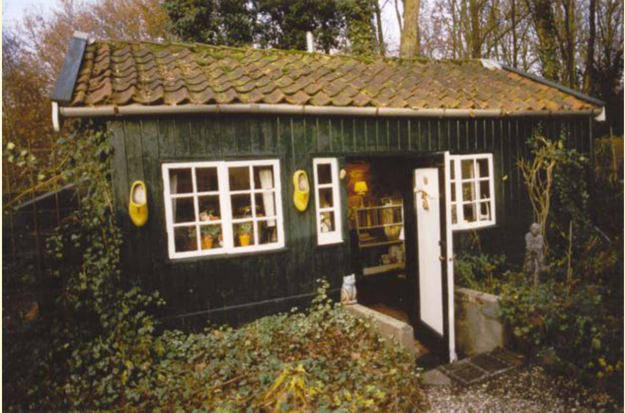
De hut van Van Eeden op Walden, 1898