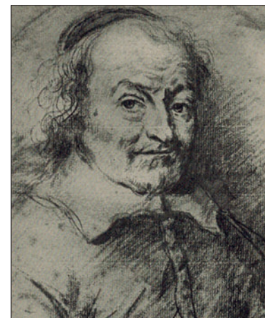
Joost van den Vondel. Tekening door een onbekende.

In 1867 voer een schip vol notabelen en geleerden de haven van Muiden in