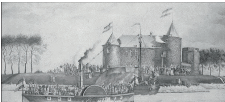
De boot met genodigden komt aan. Tekening uit 1867.

FOTO EN TEKST GEMEENTEARCHIEF GOOISE MEREN EN HUIZEN