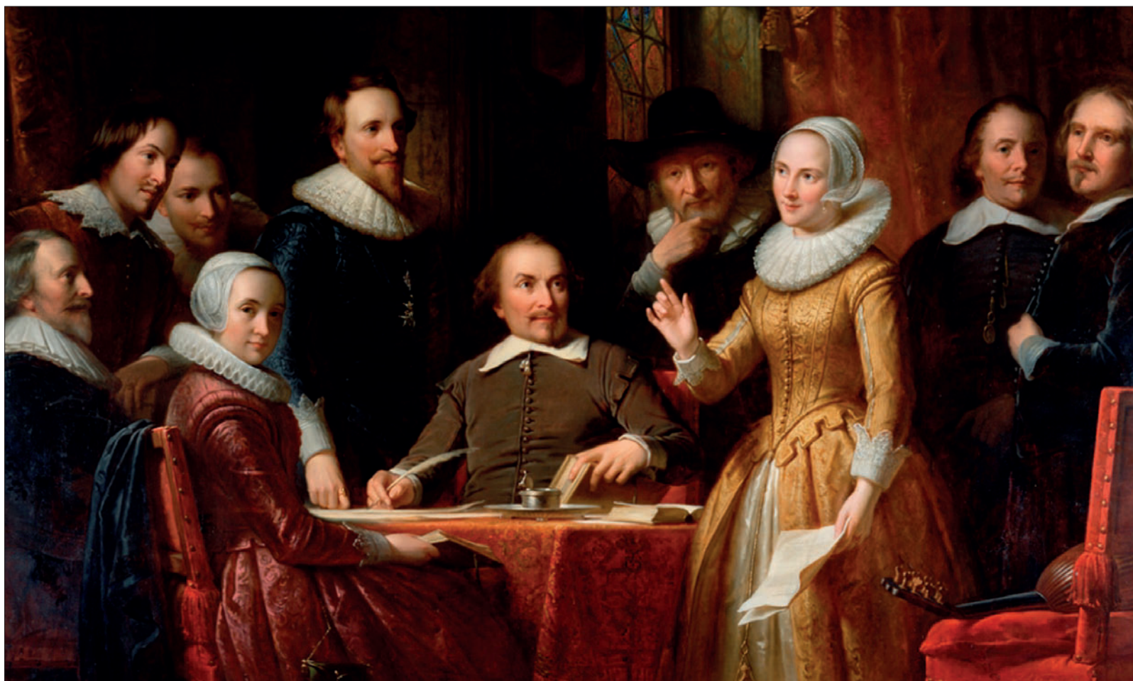
Jan Adam Kruseman: Neêrlandsche Dicht'ren rei, verenigd bij den ridder Hooft, op het slot te Muiden. 1852.

De Muiderkring als vast cultureel gezelschap heeft nooit bestaan. In de zeventiende eeuw was het gebruikelijk dat intellectuelen in hun vrije tijd schreven en musiceerden. De Amsterdamse koopman en schrijver Roemer Visscher nodigde tussen 1600 en 1620 regelmatig getalenteerde jongeren uit om zich met elkaars voordracht en muziek te komen vermaken in zijn huis aan de Engelse Kaij, de huidige Gelderse kade. Onder de genodigden waren dikwijls Hooft, Vondel, Bredero en een enkele keer ook de Hagenaar Constantijn Huygens. Zij raakten goed bevriend met twee dochters van Roemer: Anna en Maria Tesselschade. Na de dood van Visscher in 1620 bleven zijn dochters die bijeenkomsten nog enkele jaren organiseren.