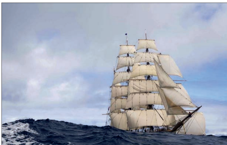
■ Een fregat in vol zeil.