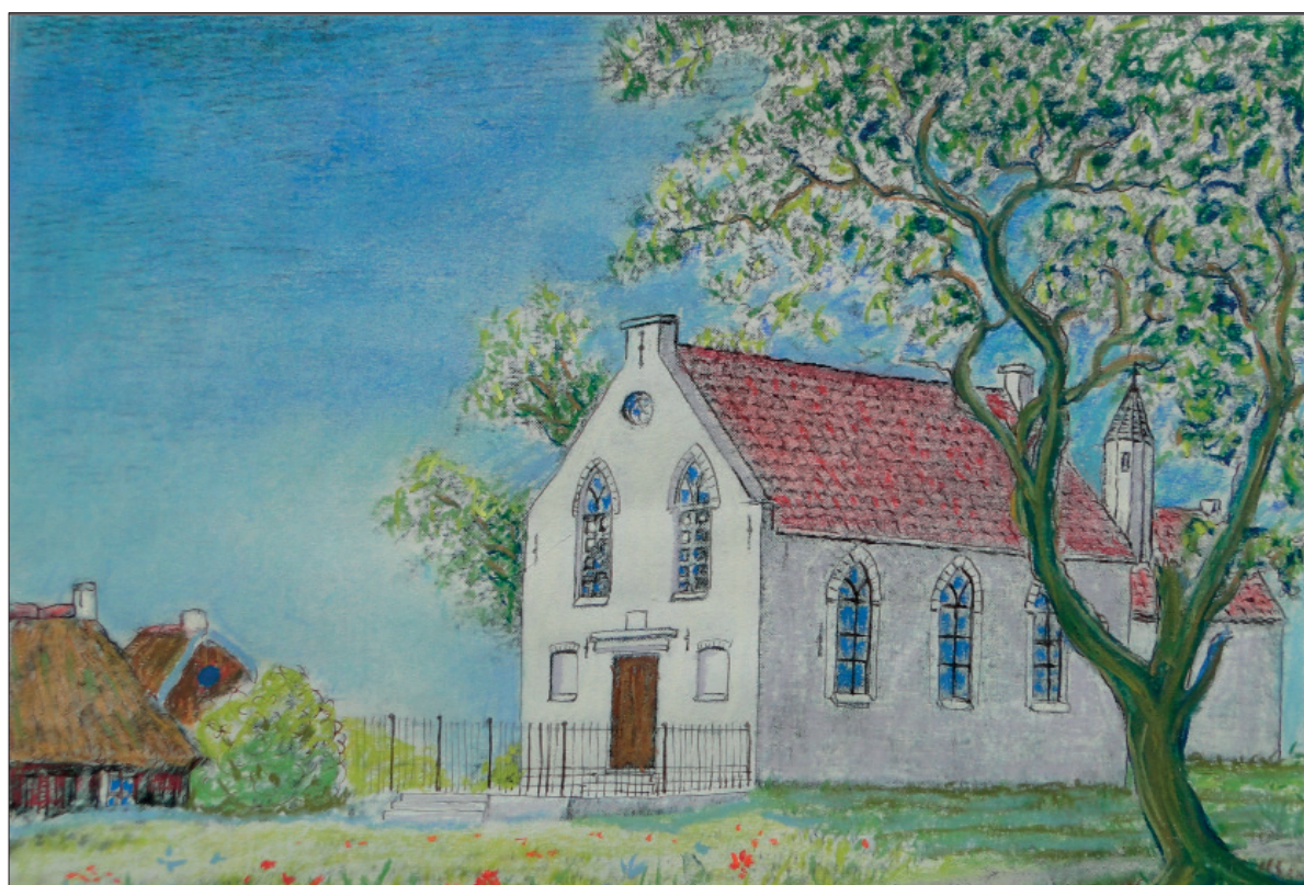
■ De eerste N.H. kerkje achter de kapel (tekening auteur).