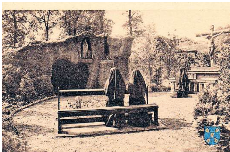
■ De Lourdesgrot van het Majellaziekenhuis.