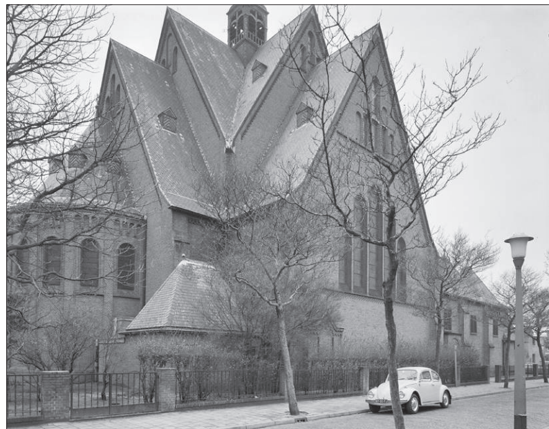
De Clemenskerk aan de Bosdrift in Hilversum.