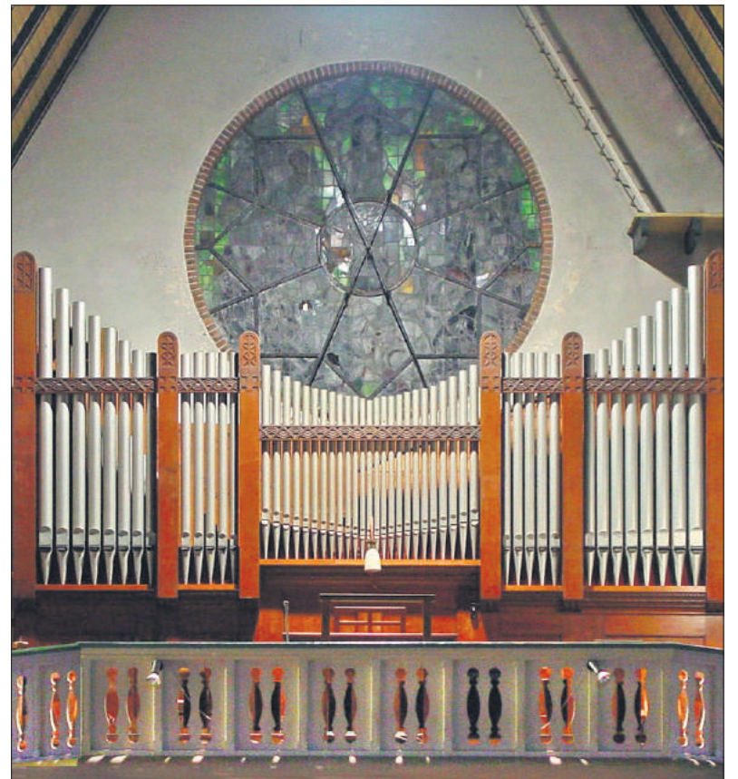
Het orgel in de Clemenskerk.

Het orgel bleef buiten de boedeloverdracht. Van meet af aan was het de bedoeling van het bisdom het orgel in een andere kerk onder te brengen. Gelukkig mocht de subsidie voor de restauratie mee naar de nieuwe locatie. En zo kwam de Steinmeyer in de Bussumse Mariakerk (Koepelkerk)