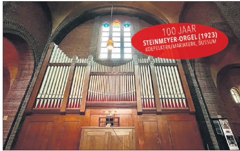
Op zijn nieuwe plek in de Koepelkerk.

Daarna braken rustiger tijden aan, want het orgel werd uitsluitend voor kerkelijke doeleinden gebruikt – er mochten in katho-