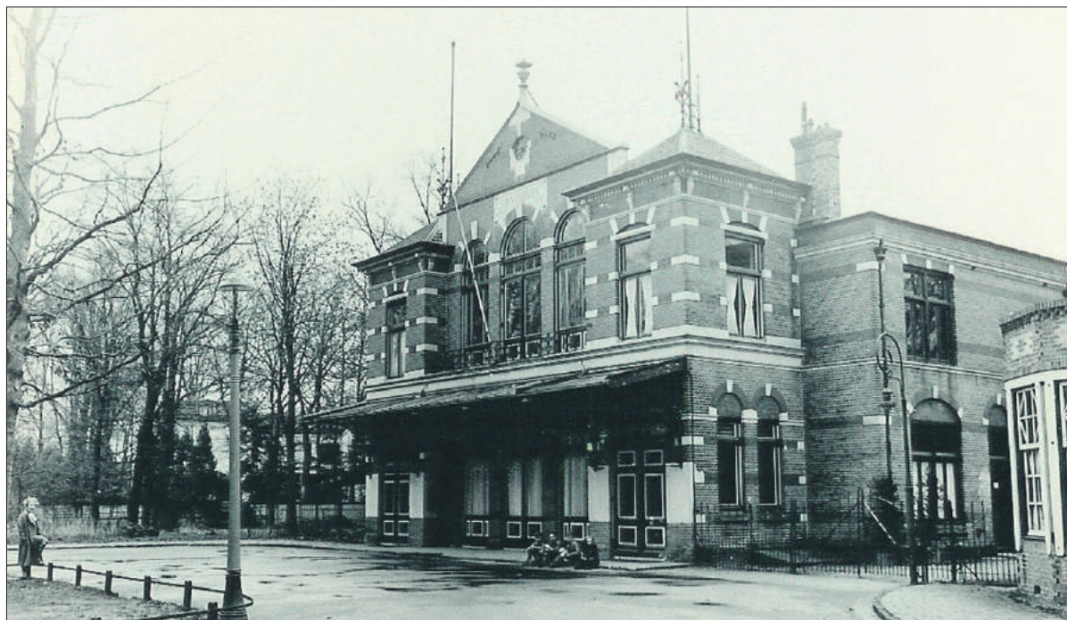
■ Theater Concordia voor 1930.

werd in 1920 al op neergekeken: je kon toch wel lezen! Explicateurs waren er toen alleen nog bij documentaires, die de film zelfs stilzetten als hun uitleg meer tijd vergde.