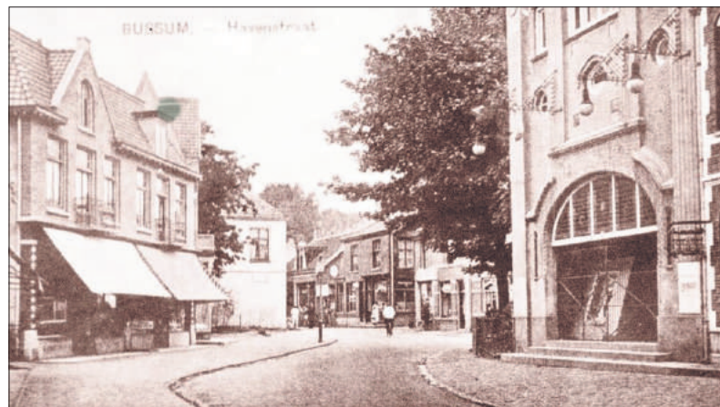
■ De Havenstraat met rechts bioscoop Flora Bio.