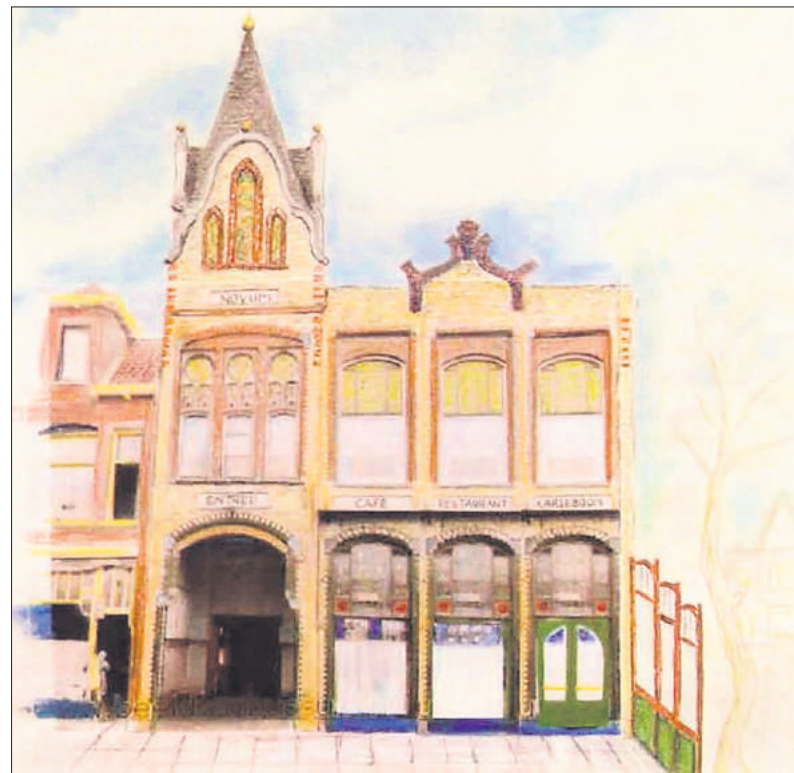
■ Theater Novum aan de Vlietlaan.

De films hadden zeker tot 1927 nog geen geluidsspoor. Ze werden in Bussum vaak door een pianist of organist en soms zelfs met zang muzikaal begeleid. Naast Amerikaanse en Duitse waren er ook enkele Nederlandse speelfilms. Door in de film opgenomen tekstborden was de film te volgen. Rond 1905 was er in de bioscopen ook vaak een explicateur, die met de beelden mee vertelde en in de film passende geluidseffecten verzorgde, maar daar