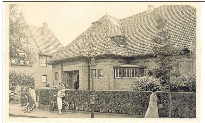
■ Ook de doopsgezinde kerk aan de Wladimirlaan werd in 1923 geopend. Het werd toen 'Huis ter Vermaning' genoemd.

Bussum had destijds zo'n twintigduizend inwoners en was ook wat de bebouwing betreft aanzienlijk kleiner dan nu. Op de kaart uit 1924 ontbreken de Ceintuurbaan en de Wester- en de Oostereng, maar ook het grootste deel van het Brediuskwartier en bijna alle bebouwing ten zuiden van de Huijzerweg. Het schootveld van de vesting Naarden was nog geheel onbebouwd. Er was schoorvoetend een begin gemaakt met sociale woningbouw in het katholieke St. Jozefpark, het protestantse Oosterpad en in de socialistische