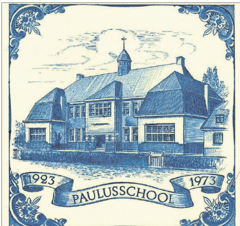
■ De School met de Bijbel werd in 1023 geopend. Later omgedoopt in Paulusschool en thans kinderdagverblijf De Bommelburcht.

Kom dus kijken. De expositie wordt geopend op zaterdag 2 september om 12.00 uur. Daarna is hij nog te zien op zondag 3 september en op zaterdag 9, 16 en 23 september, steeds van 12.00 tot 16.00 uur. Het is ook de laatste kans om de kapel van Mariënborg te bekijken, want na september begint de grote verbouwing.