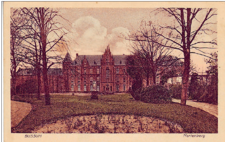
■ Klooster/pensionaat Mariënborg aan de Brinklaan.

Deze twee onderwerpen vormen het uitgangspunt voor de tentoonstelling in Mariënborg. Uiteraard zijn daar het filmpje en het fotoboek te zien. Misschien herkent u familieleden of oude bekenden! Maar het belangrijkste doel van de expositie is een beeld te schetsen