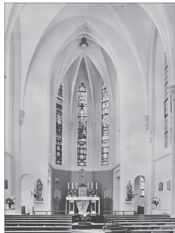
■ De kapel op de eerste verdieping van het klooster, waar de tentoonstelling te zien zal zijn.