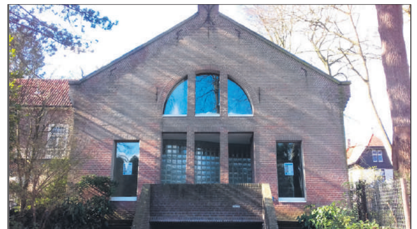
■ Huis Unger (foto Martijn Schapink).

In 1901 kon hij van zijn erfenis de architect Cornelis Kruisweg opdracht geven om een huis met een aparte atelier- en expositieruimte te ontwerpen. Dit huis werd gebouwd aan de Boslaan 2a in Het Spiegel. Het atelier had grote deuren om zijn forse schilderwerken naar buiten te kunnen krijgen. Zijn schilderijen waren zo groot dat ze alleen al vanwege hun af-