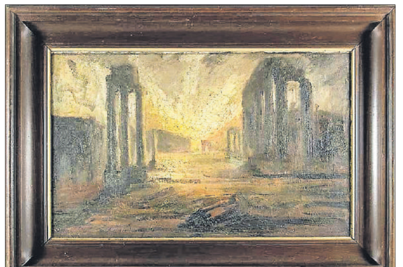
■ Gezicht op Forum Romanum in Rome (Collectie Fries Museum).

Zijn atelier is in 1981 afgesplitst van het terrein waarop de villa staat. Het is toen door architect Mart van Schijndel herschapen tot een ruim woon-werkatelier voor het kunstenaarschepaar Unger. De atelierwoning aan Parklaan 29a heet nu Huis Unger en is in bezit van de vereniging Hendrick de Keyser.