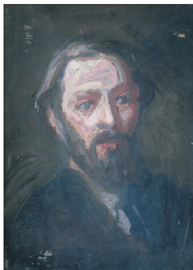
■ Portret van Pier Pander (Collectie Rijksmuseum).