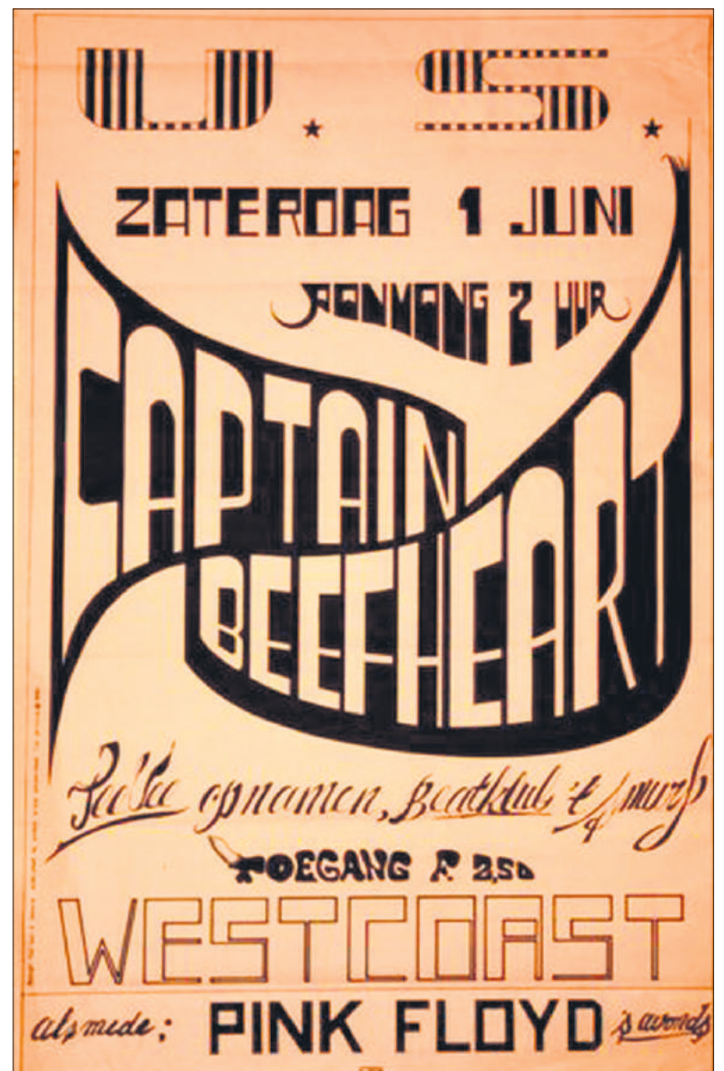
■ Affiche van de roemruchte beatclub 't Smurf uit 1968.