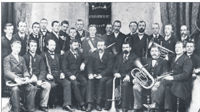
■ Crescendo in 1898.