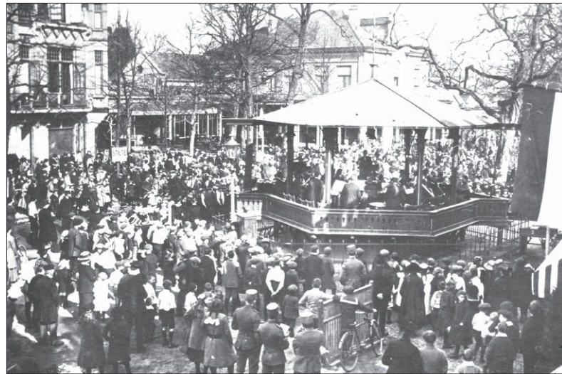
■ Concert in de muziektent op de Brink, 1900.

In 1957 werd door de broeders van St. Vitusschool de drum- en showband ViJoS opgericht, aanvankelijk alleen voor katholieke jongetjes, maar al snel ook voor katholieke meisjes en later voor iedereen. ViJoS was een doorslaand succes. Binnen de kortste keren deden er tientallen basisschoolleerlingen mee. Als ze van school af gingen moesten ze ook de drumband verlaten. De spijt