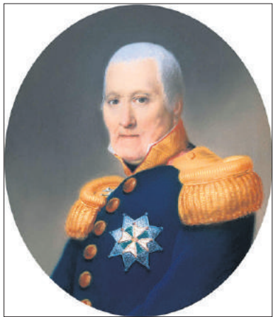
■ Luitenant-generaal C.R.Th. Baron Kraijenhoff.

Dit beleg bracht veel ellende in het kleine dorp Bussum, dat tot Naar-