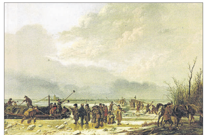
■ Het doorrijzen van de Karnemelksloot in januari 1814 met Naarden op de achtergrond. Schilderij van P.J. van Os.