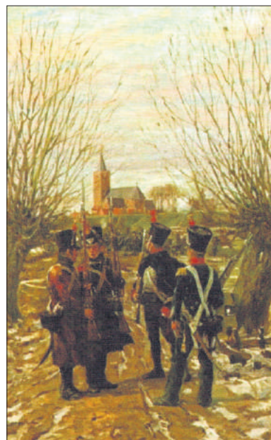
■ Amsterdamse schutterij bij Naarden met nog Franse uniformen. Schilderij van J. Hoyck van Papendrecht.

TEKST: GEMEENTEAR-