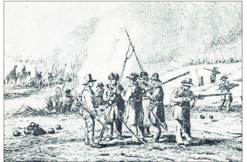
■ Leden van de Landstorm bij Naarden in 1814. Ets van P.J. van Os.

Op 6 april 1814 werd de verslagen Napoleon in Frankrijk afgezet en naar Elba verbannen. Kraijenhoff kreeg het bevel het beleg te stoppen en te beginnen met onderhandelingen met de Franse commandant Quétard. Op 12 mei 1814 verliet het garnizoen de vesting met slaande trom, het defileerde zelfs nog op de Bussumerheide voor de belegeraars, en marcheer-