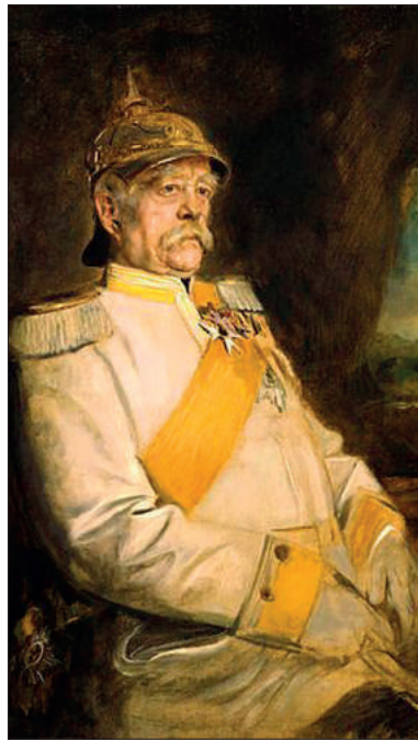
■ Otto von Bismarck, geschilderd door Franz von Lembach in 1890.

Het leger moest bij een vijandelijke aanval buiten de waterlinie een verdedigingslinie vormen. Naarden liet in 1868 vooruitgeschoven forten aanleggen waarachter het leger zich, als het werd teruggedrongen, kon hergroeperen om de vijand opnieuw te lijf te gaan. Naast de al bestaande forten en het Ericafort en het Hamerslot bij de Karnemelksloot kwamen