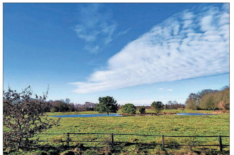
■ Het gereconstrueerde Pannenkoekenfort in het Laegieskamp.

In 1873 liet Naarden aan de Zuidoostkant het nog bestaande eilandfort Ronduit bouwen om het gebied ten noorden van de vesting te beveiligen. In hetzelfde jaar liet Muiden Fort H bouwen: een bomvrij fort waarin wapens