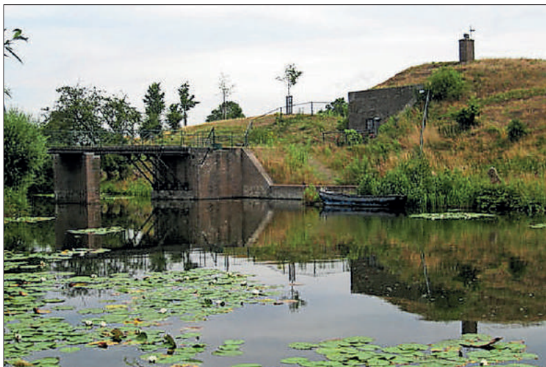
■ Fort Ronduit met ophaalbrug.

Nog op een tweede manier deed de invloed van Von Bismarck zich gelden. De achterstelling van de katholieken leidde ertoe dat veel katholieken uit Pruisen wegvluchtten. Ze gingen uiteraard naar Zuid-Duitsland, maar ook naar Nederland, waar ze bijvoorbeeld in het katholieke dorp Bussum terecht kwamen. Onder