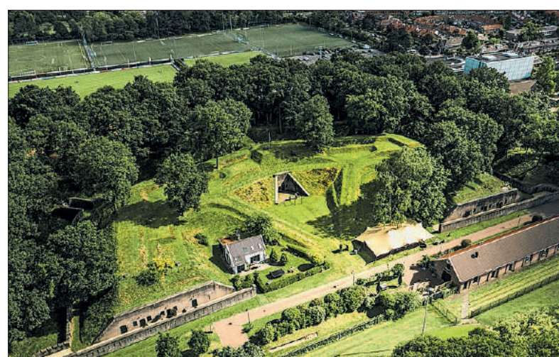
■ Luchtfoto Fort Werk IV met erachter Spant!