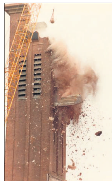
■ De sloop van der toren.