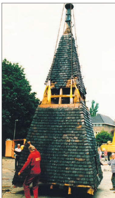
■ De torenspits is eraf getakeld.