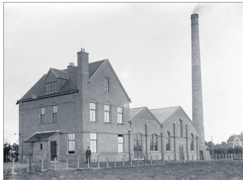
De elektriciteitscentrale aan de Prins Willem van Oranjelaan in 1899.

was er sprake van intensieve bemoeienis van de gemeentelijke overheid.