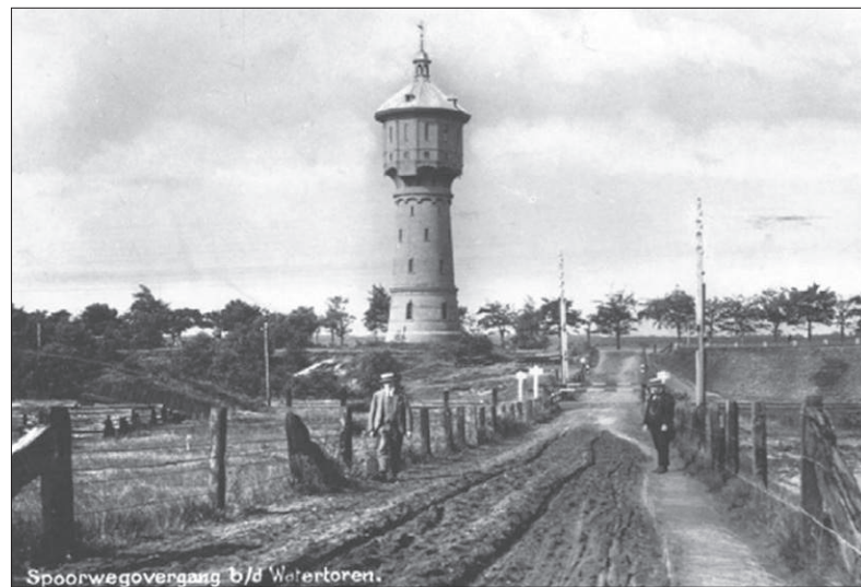
De (niet meer bestaande) spoorwegovergang bij de watertoren in 1920.

Een paar jaar later, in 1888, probeerde een aantal Bussumse notabelen de gemeente te bewegen een waterleiding aan te leggen. Dat stuitte echter op verzet bij de boerse gemeenteraad van Bussum. Er waren toch prima waterputten in het dorp? Maar in 1895 wisten enkele Amsterdamse ondernemers de gemeente toch zover te krijgen hun een vergunning te verlenen voor het bouwen van een watertoren en het aanleggen van een lei-