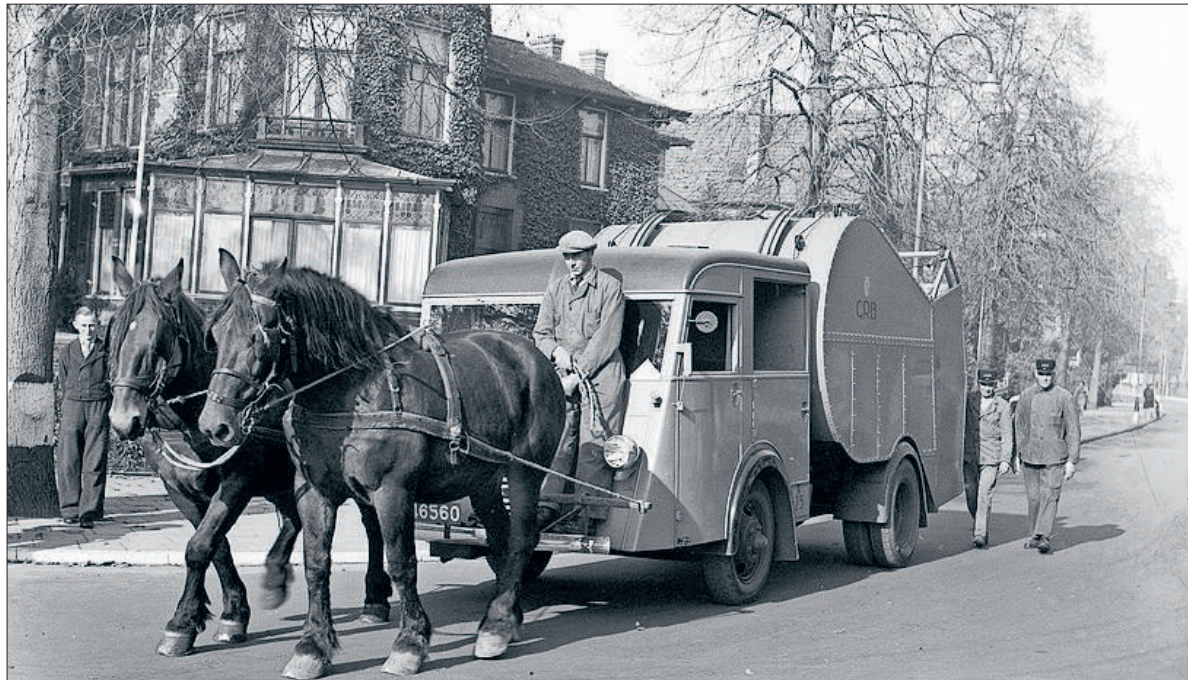
In de oorlog moesten vanwege de benzineschaarste paarden de vuilniswagens trekken.

Ook in Bussum kwamen deze faciliteiten beschikbaar, zij het met horten en stoten. Vaak waren het particuliere ondernemers die het initiatief namen, maar in de meeste gevallen ontfermde de overheid zich al gauw over deze 'nutsvoorzieningen', juist omdat de ongestoorde beschikbaarheid daarvan voor alle inwoners van cruciaal belang was (en is). De overheid, dat was aanvankelijk de gemeente. Vandaar (het ontstaan van) een gemeentelijke gasbedrijf en een gemeentelijk elektriciteitsbedrijf. In Bussum bleef waterleiding lang in particuliere handen, maar ook daar