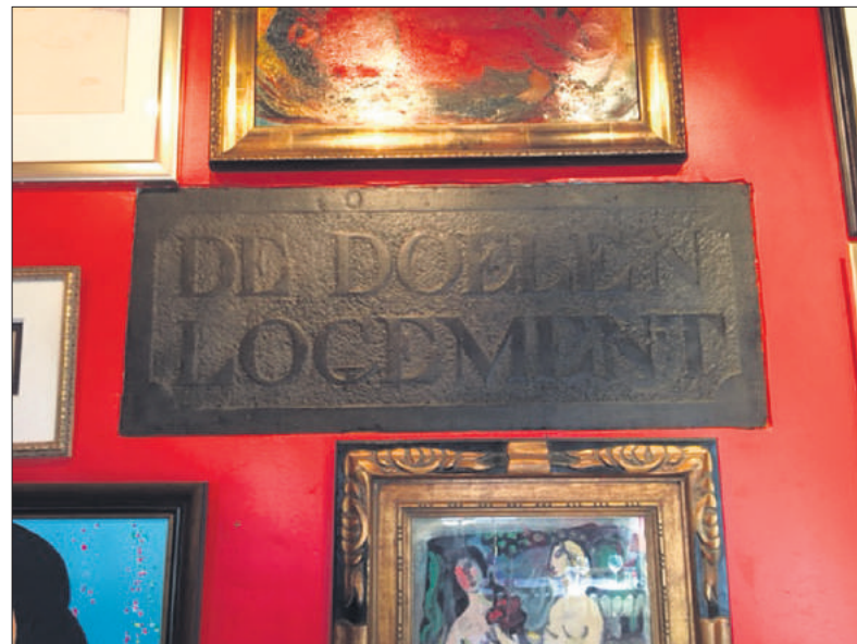
De gevelsteen uit 1812 hangt nu tussen de schilderijen.

FOTO EN TEKST: STREEKARCHIEF GOOISE MEREN