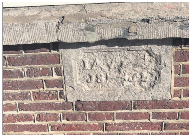
De gevelsteentje met het jaartal 1812.