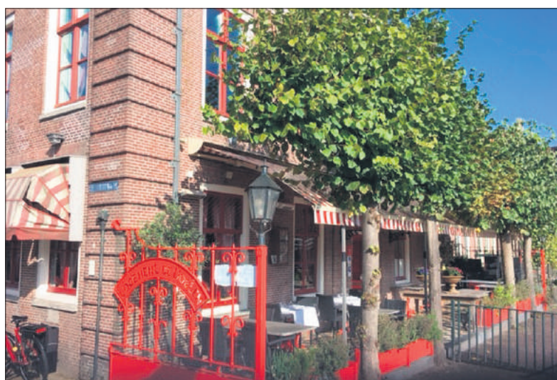
Het restaurant nu.

kocht. Het wisselde vervolgens nog verschillende keren van eigenaar voordat het in 1968 in handen kwam van Reinier Verwey Beheer, die er weer een restaurant van maakte: restaurant De Doelen. De gevelsteen in de eetzaal en het sierlijke terrashek herinneren aan het verleden als 'logement'.