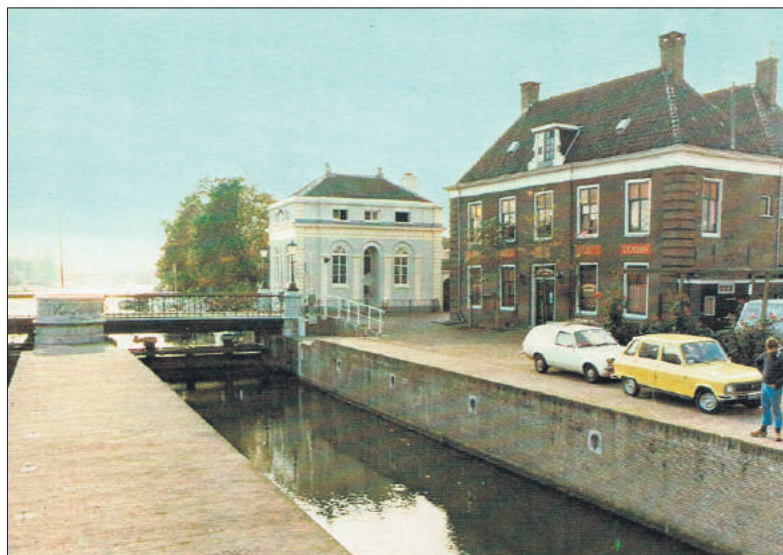
De bistro 'Bodega De Doelen' in de jaren 70.

In 1809 werd het pand publiekelijk geveild en nu was de koper Willem Goeman. Deze eigenaar