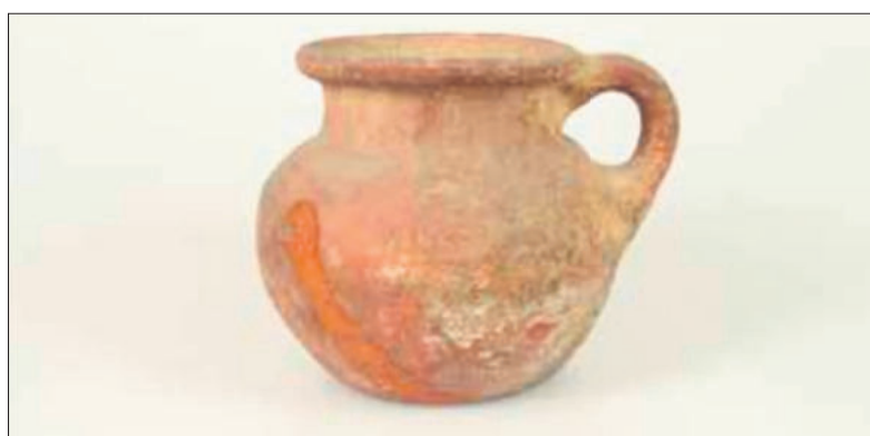
■ Gevonden pispot uit de periode 1375-1425.

UIT DE FOTOCOLLECTIE VAN HET STREEKARCHIEF www.gooienvchthistorisch.nl 035 207 09 99 Cattenhagestraat 8, Naarden