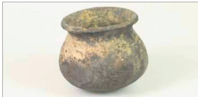
■ Gevonden kookpot uit de twaalfde eeuw (foto Huis van Hilde).

UIT DE FOTOCOLLECTIE VAN HET STREEKARCHIEF www.gooienvchthistorisch.nl 035 207 09 99 Cattenhagestraat 8, Naarden