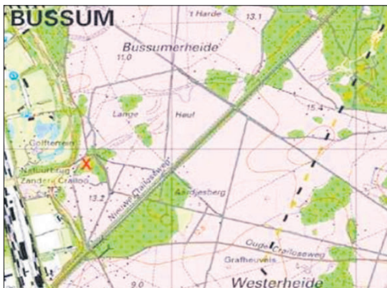
■ Topografische kaart van 2011, met de X is de locatie aangegeven van de opgegraven boerderijplaats aangegeven. Bewerking: Sander Koopman.

Eind jaren '60 kwam de zandafgraving van Crailloo wel erg dicht in de