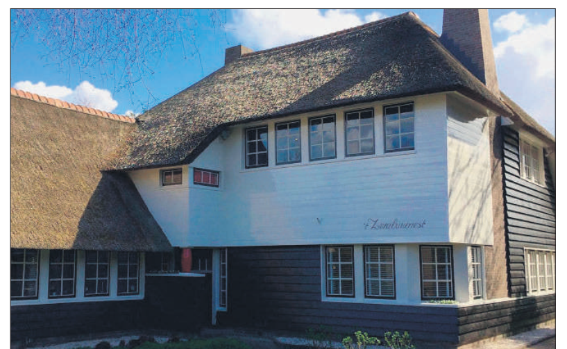
■ 't Zwaluwnest, één van de houten 'middenstandswoningen' in Naarden.