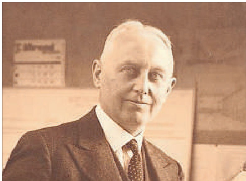
■ Willem Marinus Dudok.