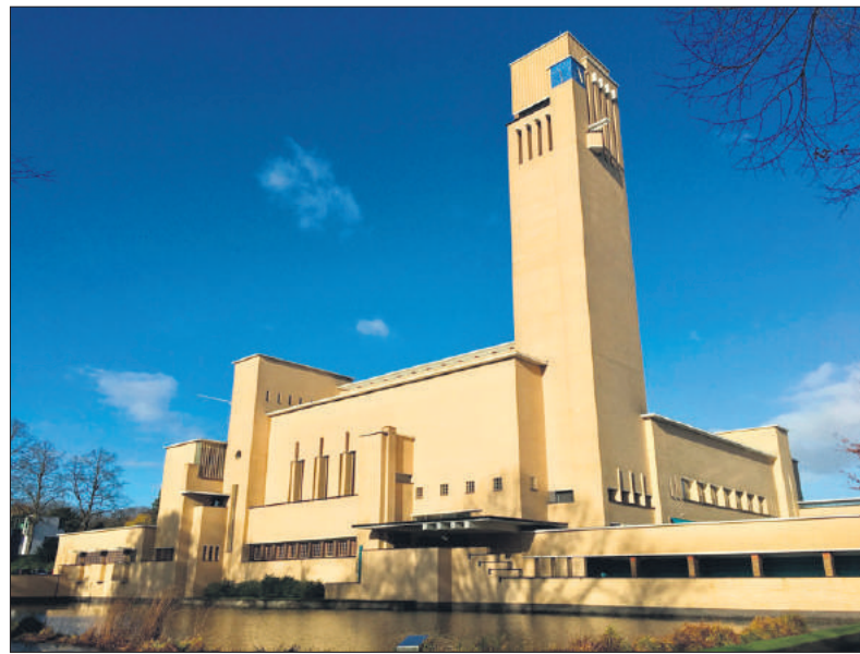
■ Het raadhuis van Hilversum.

Aan de militaire academie in Breda volgde hij de opleiding tot civiel ingenieur, met als extra bijvakken bouwkundig tekenen en ontwerpen. Onder de indruk van zijn talent voor tekenen vroeg de staf hem te assisteren bij het ontwerpen van militaire gebouwen in de stijl van Berlage. Na zijn eervol ontslag uit het leger werd hij in 1913 in Leiden plaatsvervangend directeur van Gemeentewerken. Hij ging samenwerken met de zelfstandig gevestigde architect J.J.P. Oud, met wie hij al spoedig bevriend raakte. Hij ontwierp de Leidse HBS, waarin tegenwoordig het Bonaventura College gevestigd is. Samen met Oud ontwierp hij het gebouw voor het Leidsch Dagblad aan de