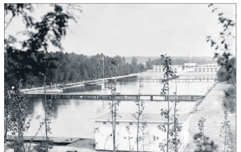
■ Zwembad Crailoo