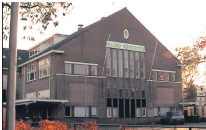
■ Studio Concordia.