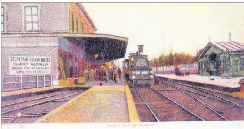
■ Station Naarden-Bussum met klaarstaande trein en op de voorgrond het eindpunt en perron van de stoomtram (1906).