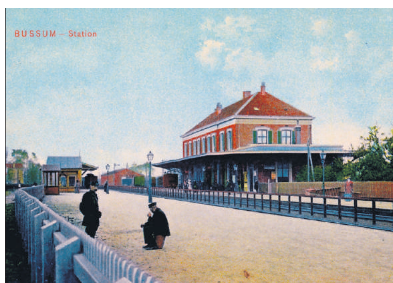
■ Perron richting Hilversum van station Naarden-Bussum (1904).

bouw. Het station was inmiddels uit de tijd, de wachtkamers waren ongerieflijk, haveloos en onogelijk, het perron was te klein en onbeschermd en elke morgen ontstond er een enorm gedrang. In 1913 werd het besluit voor een nieuw station genomen, maar als gevolg van Eerste Wereldoorlog zou het tot op 10 september 1926 duren voor het nieuwe station in gebruik kon worden genomen.