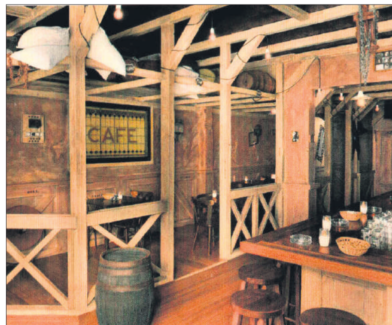
■ Interieur café Cécil in de jaren 80.