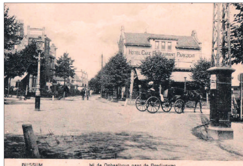
■ Hotel Parkzicht.