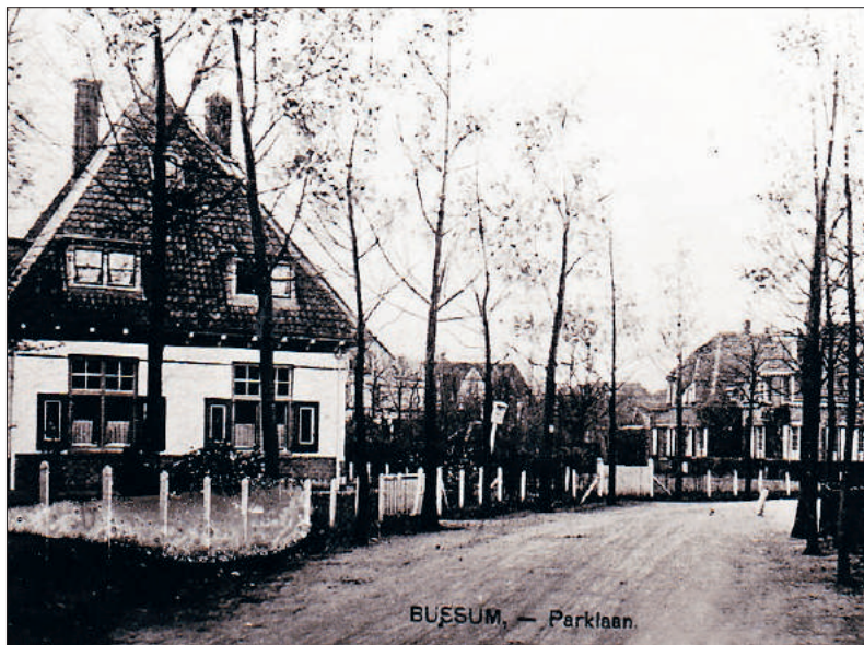
Rechts het huis na de eerste verbouwing.