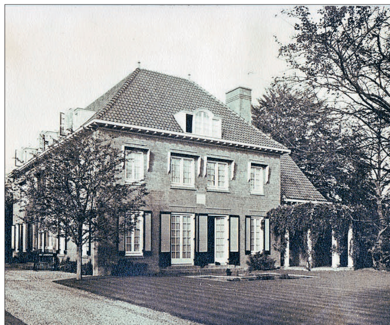
Het huis na de tweede verbouwing, dat er nog steeds is.