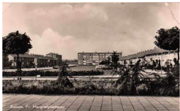
Figuur 13 Prinses Margrietplantsoen

Links op de hoek van Hurmanlaan stond vanaf 1953 de Timotheüschool, een (protestantse) School met den Bijbel. In 1967 werd de school omgedoopt in De Wegwijzer. In 1987 gesloten en afgebroken en vervangen door 2 kleine appartementengebouwen.