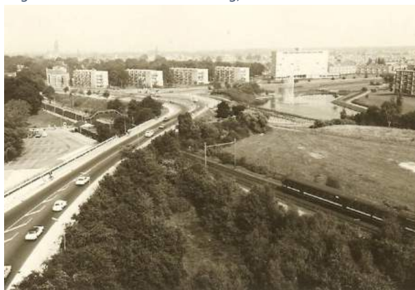
Figuur 4 Viaduct in 1968

In de loop der tijd zijn er steeds stukken afgeknabbeld ten behoeve van woningbouw. Dat begon al in 1914, toen het St. Jozefpark werd gebouwd.