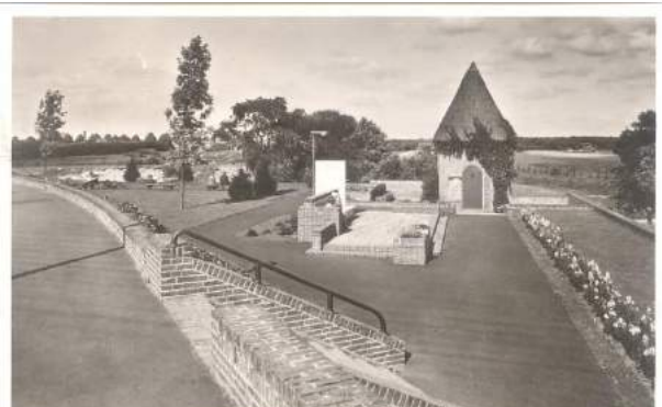
Figuur 2 Parkje met De Bordesbank, 1938

Rechts passeren we het restant van het parkje dat hier vroeger was, met de Burgemeester De Bordesbank. Het parkje is aangelegd tegelijk met het viaduct, in 1929. Een paar jaar later werd bij het 12,5 jarig ambtsjubileum van de burgemeester de De Bordesbank er aan toegevoegd. Er was toen nog geen vijver. Die werd in 1940 uitgegraven (tot 10 m diep) om met het zand de haven van Bussum en de Bussumervaart tot aan de Brediusweg te dempen. Aanvankelijk bleef het gewoon een diep (zand)gat.