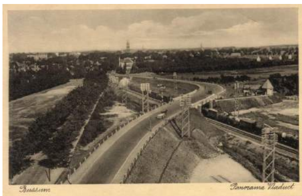
Figuur 3 Viaduct net na de aanleg, 1929