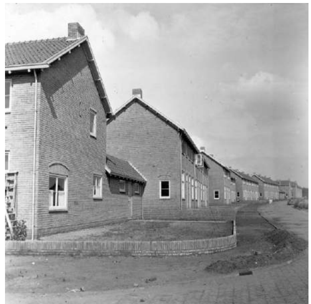
Figuur 16 De Versteeghstraat in 1942 (Engweg)

We zijn nu midden in de verzetsliedenbuurt. Aan het einde van de straat, op de hoek met de Versteeghstraat is in 2021 op initiatief van de HKB een plaquette aan de muur bevestigd die informatie geeft over degenen die in deze buurt vernoemd zijn. Op 4 mei 2023, is daar nog een informatiebord aan toegevoegd met de portretten en korte beschrijvingen van deze verzetslieden en een QRcode 1 waarmee u naar onze website gaat om nog meer informatie omtrent deze verzetsmensen te lezen. De huizen aan de noordzijde van de Versteeghstaat zijn al in 1942 gebouwd. De straat heette toen nog de Engweg.