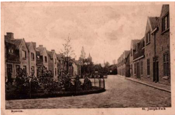
Figuur 7 De peppels

dit riante arbeidershuizen, waar overigens vaak met grote gezinnen in werd gewoond.