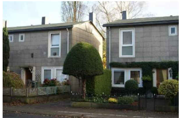
Figuur 12 Aireywoningen aan de Bottemastraat

Aan het einde van de straat zien we een rij zogenoemde Airey-woningen uit 1950, genoemd naar de uitvinder van het procedé. Het was destijds een van de eerste voorbeelden van prefab-bouwen. Ze werden in no time in elkaar gezet en bestaan uit vooraf in de fabriek gebouwde betonnen elementen. Standaardmaten en standaardplattegronden. Er zijn in Nederland zo'n 5000 eengezins woningen van dit type gebouwd. In het Gooi zijn dit de enige voorbeelden. Daarom is het ensemble een gemeentelijk monument. In 2010 zijn ze zorgvuldig gerestaureerd en geïsoleerd.