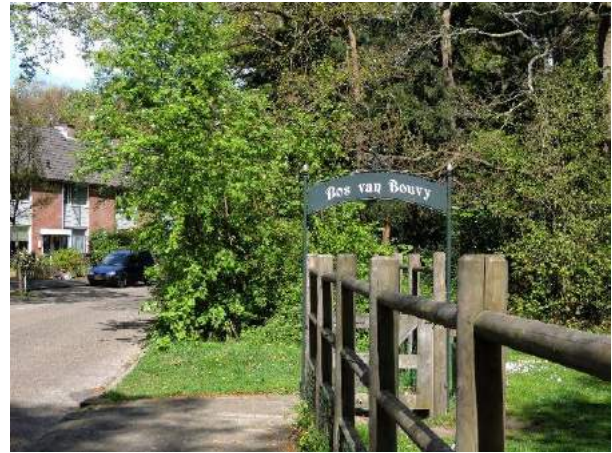
Figuur 6 Speeltuintje Bos van Bouvy