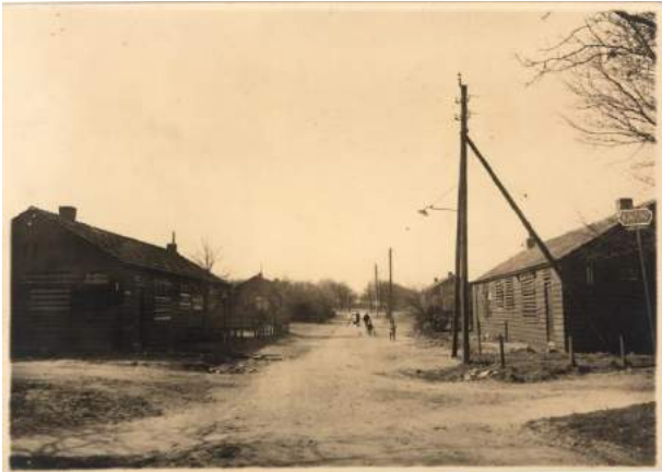
Figuur 14 De houten huisjes van de Kaap, 1932

reputatie aan over. De 29 huisjes zaten vol vlooiën en werden in brand gestoken.