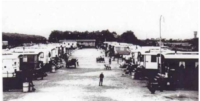
Figuur 15 Woonwagenkamp aan de Laarderweg, 1934

Daarna werd er een woonwagenkamp ingericht voor de woonwagenbewoners van de Fransche Kampheide, die in 1934 hiernaartoe verhuisden. In 1951 werd ook dat kampje (17 wagens) opgeheven en verplaatst naar de huidige locatie aan de Zanderijweg.