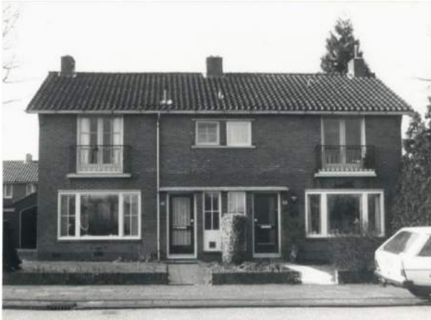
Figuur 11 Boumawoningen aan de De Ruyterlaan

Deze huizen werden goedkoop gebouwd doordat de verdiepingshoogte lager was dan gebruikelijk, wat in totaal 10 lagen baksteen uitspaarde.