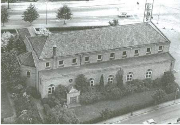
Figuur 9 St. Jozefkerk

Ook de huizen om de kerk heen werden toen gebouwd.