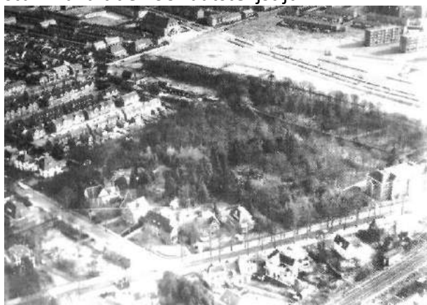
Figuur 5 Bos van Bouvy in de jaren 50

Het gebied achter de school was onbebouwd. Het behoorde bij de villa van de familie Bouvy aan de Singel, nr 6. Dat gebied liep aanvankelijk van de Singel tot aan wat nu de Dennen is en van de Brinklaan tot aan de Laarderweg. In het midden ligt nog steeds een verhoging, restant van een stuwwal uit de voorlaatste ijstijd.