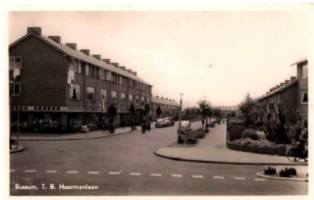
Figuur 10 Begin van de Hurmanlaan

In 1950 lanceerde wethouder Bouma zelfs de zogenoemde Bouma-woningen: een plan voor meer dan 300 huizen tussen de Hurmanlaan en de De Ruyterlaan.