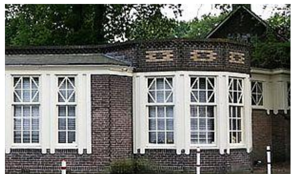
Lage deel Concordia

Concordia was vanaf 1897 het cultureel centrum van Bussum e.o. Na brand in 1930 is dit Concordia gebouwd, waar het Concertgebouworkest speelde, maar ook Mussert sprak. Het lage deel rechts is nog origineel. In de jaren 60 TV-studio waar Willem Duys zijn Vuist presenteerde.