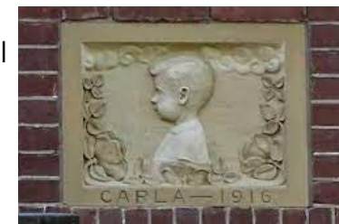
Gevelsteen aan de Waldecklaan 28

In deze laan hebben de huizen veelal dezelfde bouwstijl. Hier is het opvallend dat meerdere huizen gevelstenen met meisjesnamen hebben. Waldecklaan 28 Carla – 1916, Waldecklaan 17 Margareth, Waldecklaan 15 Anny Home, Waldecklaan 16 Klara, Waldecklaan 14 Sophia