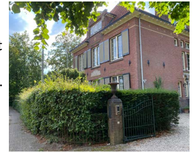
Op den Akker

Landhuis Op den Akker, Parklaan 35 , is gebouwd in het laatste kwart van de 19de eeuw in eclectische stijl. Het was oorspronkelijk een klein huisje van schrijver en kunstenaar Jan Veth. In 1902 is de villa door zijn vriend K.P.C. de Bazel verbouwd, die zei “blijf er maar in wonen, ik bouw er wel een muur omheen en ga buiten aan de gang”.