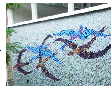
Mozaïek in Koningsbos