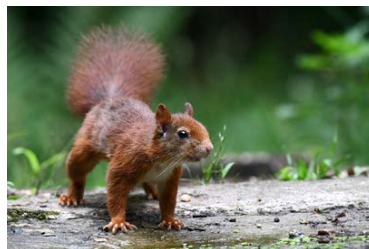
Eekhoorns in Het Spiegel

Is het wellicht al opgevallen dat er eekhoorns uw pad kunnen kruisen? Deze beestjes wonen en verblijven volop in het uitbundige groen van Het Spiegel.