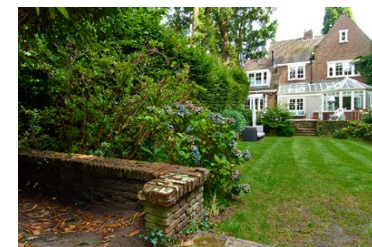
Groot Hertoginnelaan 28

Het landhuis op Groot Hertoginnelaan 28 heeft een bijzondere lange smalle achtertuin: een 'tunnel van groen'. Het ontwerp van mejuffrouw T. Cool is naar zeggen in tact gebleven.