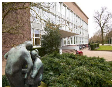
Willem de Zwijger College

De school ( Nieuwe 's-Gravelandseweg 38 ) werd opgericht op 24 april 1920 als lyceumafdeling van de Luitgardeschool, een kostschool voor meisjes met een driejarige HBS en een bovenbouw met extra talen en huishoudelijke vakken. In 1923 werden ook jongens toegelaten en verviel de naam van de meisjes-school. De school heette vanaf toen het (Christelijk) Lyceum en was gevestigd in Villa Nieuwburg. In 1942 vorderden de Duitse bezetters het gebouw en na 1946 werd de school hersteld en weer in gebruik genomen. In 1955 is de villa gesloopt en het nieuwe gebouw werd aanmerkelijk groter. De naam werd gewijzigd in Willem de Zwijger College.