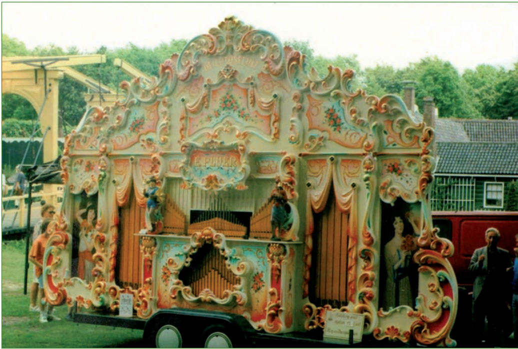
Het grote draaiorgel De Lotusfluit van Elbert Pluer

tuincentrum in Oostenrijk bestelde een orgel waarop tulpen geschilderd moesten worden. Naast deze grote orgels heb ik een stuk of zes kleinere gebouwd.'