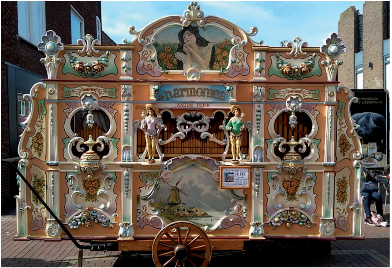
De Amsterdamse Harmonica van Anton Pluer

meer waren, was het onderhouden ervan bij de eigenaren een belangrijk onderdeel van het bedrijf. Daarvoor moest je vaak op reis, bijvoorbeeld naar de Efteling, waar we alle orgels in onderhoud hadden. In 1987 hebben we deze locatie aan de Noorderweg gekocht, omdat we voor de uitbreiding van het bedrijf aan de Verbindingslaan te weinig ruimte hadden.'