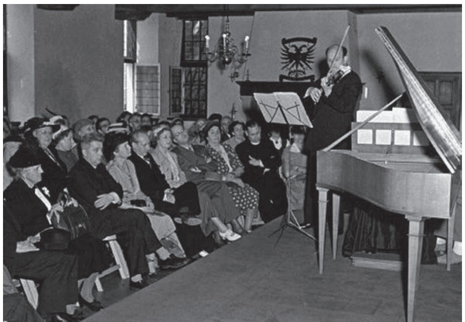
Concert in de Burgerzaal t.b.v. Diaconessen-Ziekenhuis in 1950