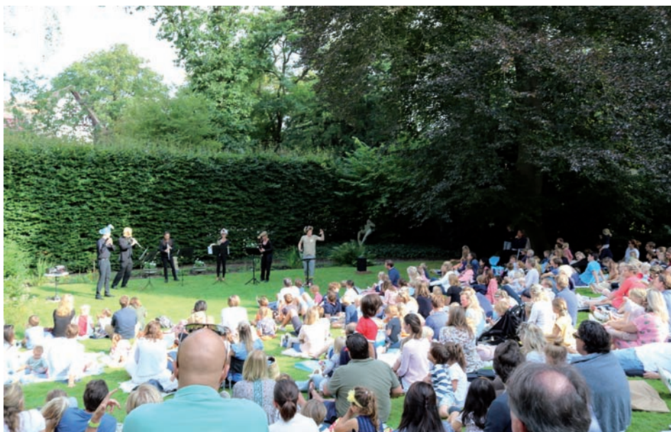
Tuinconcert voor kinderen, Peter en de wolf, uitgevoerd door een acteur en een blaaskwintet, 19 september 2021

ooit in de Tindalvilla speelden, zijn inmiddels gevestigde namen geworden. Ook musici met reeds gevestigde namen gaven acte de présence, zoals Ton Koopman en Ronald Brautigam, die in 1982 de Nederlandse Muziekprijs kreeg.