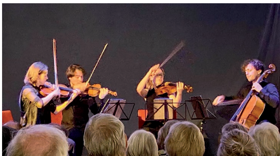
Animato Kwartet bij De Kleine Zaal om de hoek, 10 december 2022