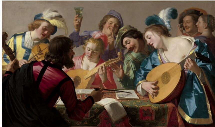
Gerard van Honthorst, Het concert , 1623

Al in de 17de eeuw huurden de in de Gouden Eeuw rijk geworden kooplieden in Amsterdam zangers en musici in om in hun salons op te treden. Men maakte ook zelf muziek. Op schilderijen uit die tijd zien we dat niet alleen voor de gegoede burgerij, maar ook voor de eenvoudige lieden het zingen en spelen op instrumenten een bron van vermaak was. De liedboeken waren niet aan te slepen! In de 18de eeuw verschenen allerlei muziekmethoden die ervoor zorgden dat meer mensen in de huiselijke kring serieuze muziek konden beoefenen.