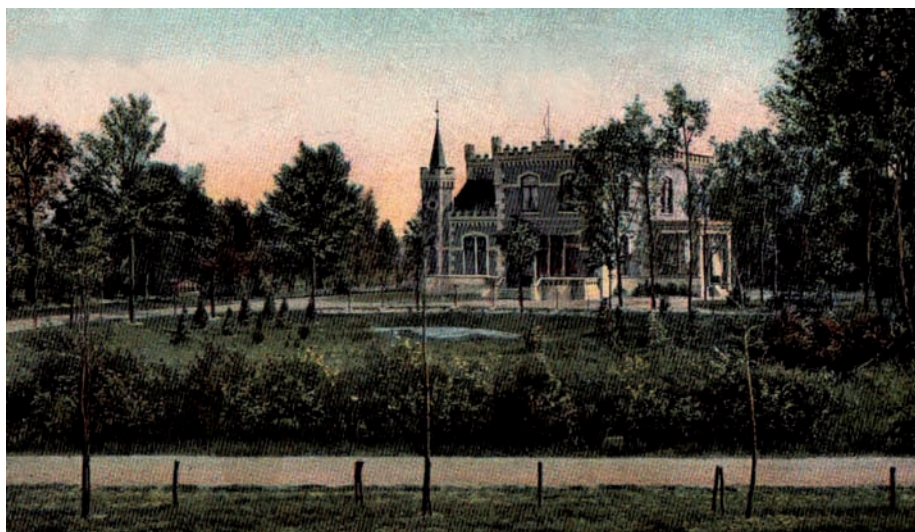
Villa Maria's Heuvel