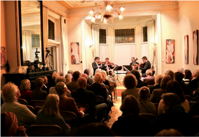
Zemlinsky Quartet uit Praag, 17 maart 2022

opvolger Jurriaan Röntgen in 1982 aantrad, liet deze de musici zelf het concert toelichten.