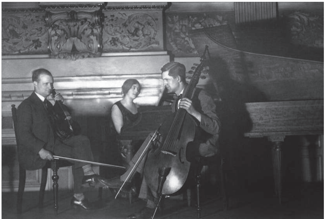
Trio Ehlers-Hindemith