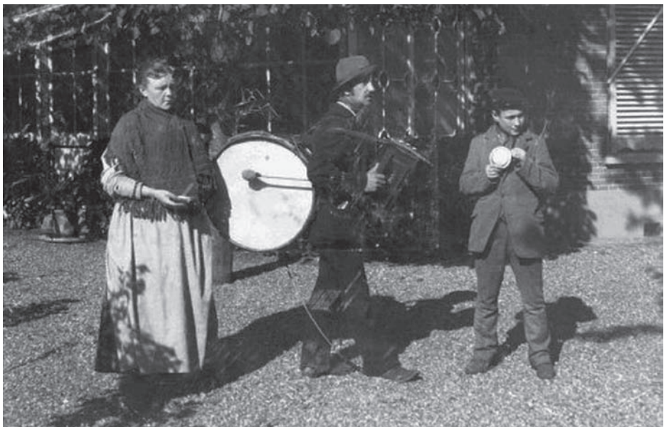
Straatmuzikanten in de tuin van De Rozenboom, 1900

Naast serieuze klassieke muziek en muziek van harmonieorkesten en koren, bestond en bestaat er in Bussum natuurlijk ook lichtere muziek: vooral dansmuziek en populaire muziek.