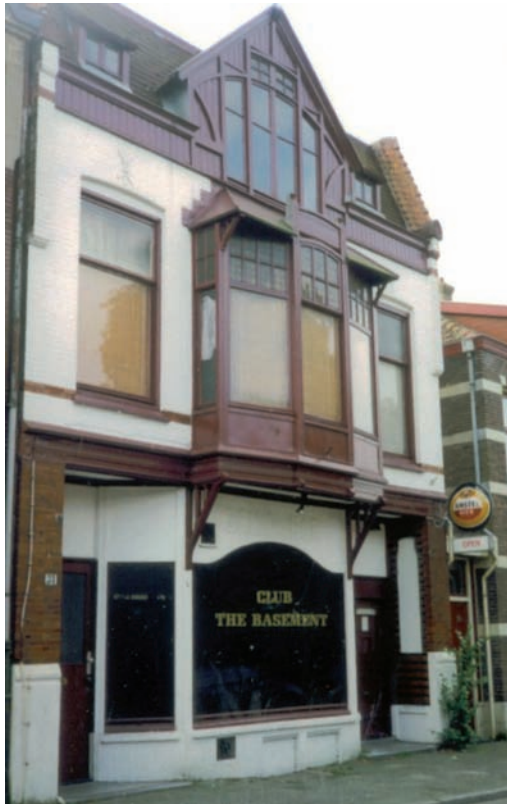
Nachtclub The Basement aan de Herenstraat

ren. Op 3 juli 1964 was dat de Hilversumse band The Fancy Five en op 28 juni 1965 The Rascal Rout.