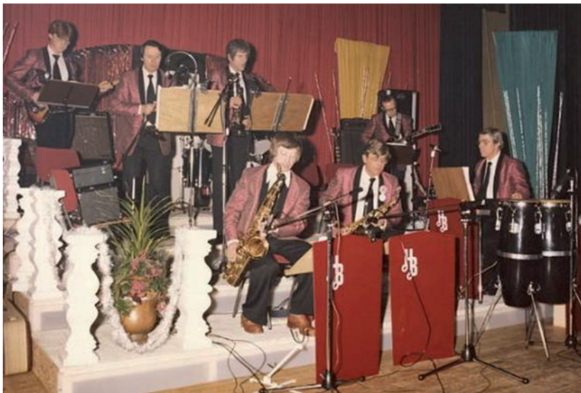
The Heartbreakers