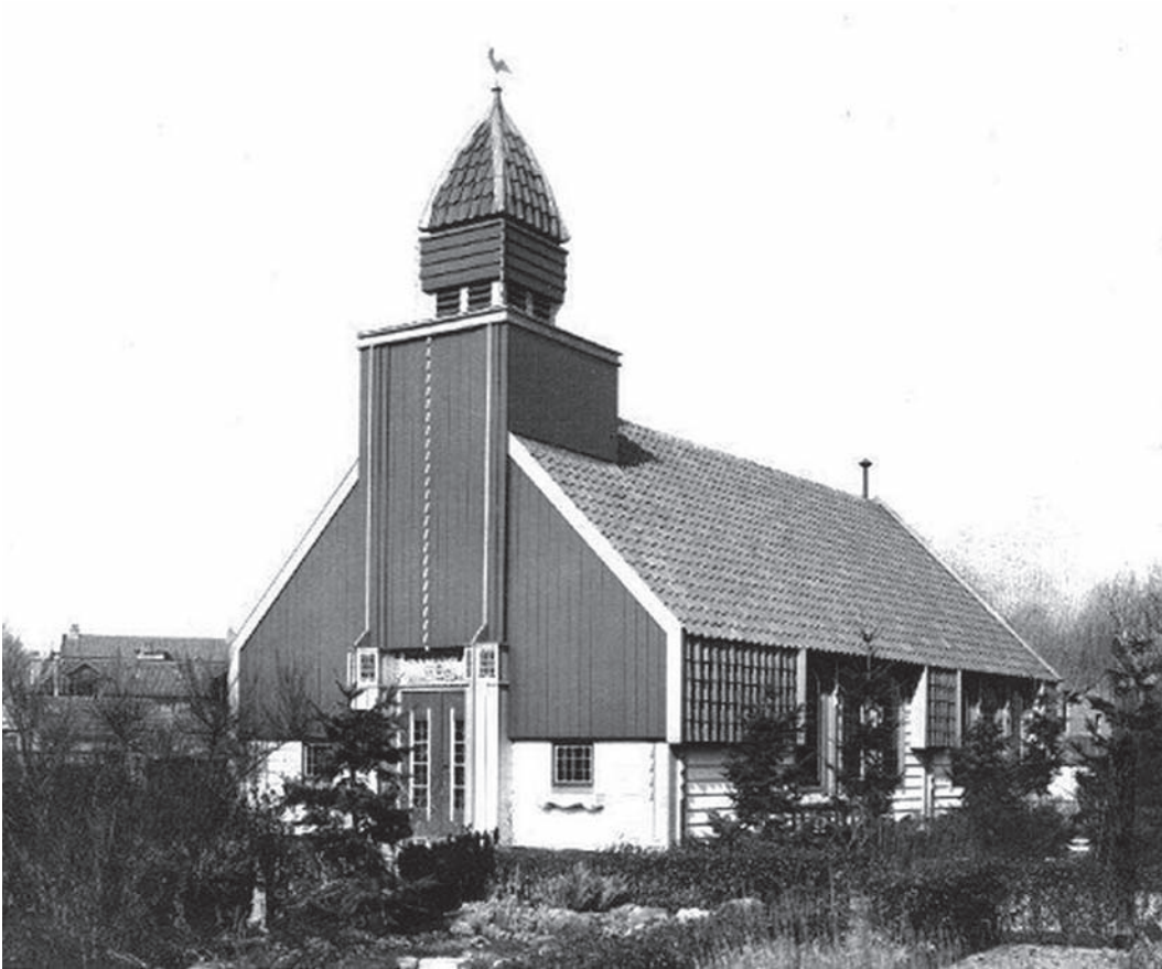
De Jeugdkapel aan de Meentweg

Folksongclub 2 benee A.P., in kleine zalen 't Mandje en 't Vat en in de grote zaal 't Smurf.