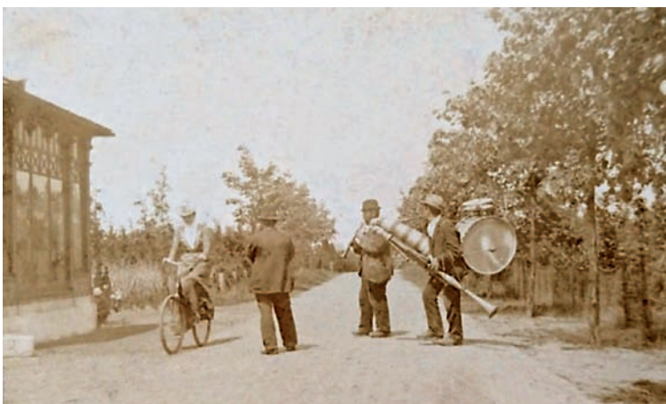
Italiaanse straatmuzikanten in 1902

Op de kermis in 1907 stond 'De Smet's Ronde Danssalon, met Elektriciteit verlicht en maar liefst 300 bekleede stoelen, een