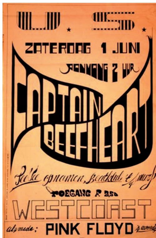
Affiche van 't Smurf

De geschiedenis van de beatclub 't Smurf is bijzonder. De kelder onder slagerij Hendrikse aan de Landstraat was aanvankelijk de oefenruimte van de band Shock, maar werd door zoveel jongeren bezocht dat het van lieverlede een beatkelder werd. Het grote aantal jongeren in de kelder die maar één ingang had leverde echter een gevaarlijke situatie op, die de gemeente ertoe bracht de beatkelder door de politie te laten sluiten. Met hulp van de gemeente konden de activiteiten niet veel later worden voortgezet in de grote zaal van buurthuis De Engh. De zo ontstane beatclub 't Smurf programmeerde bekende bands, waarvoor het publiek van heinde en verre toestroomde. De club schreef geschiedenis toen op 1 juni 1968 de Engelse band Pink Floyd er optrad.