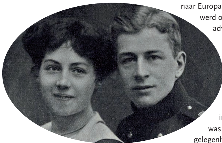
Hens en Wobinna omstreeks 1914

werd ook in Bussum in de advertenties van Concordia en andere dansgelegenheden steeds vaker vermeld dat een 'jazzband' de muziek verzorgde. Een bekende Bussumse jazzband die vaak in Concordia optrad was The Jolly Jokers. Ter gelegenheid van zijn eenjarig