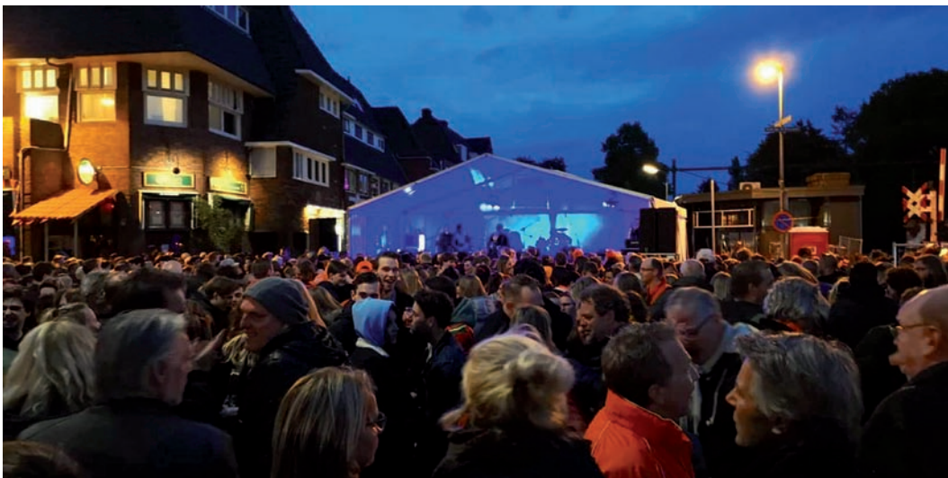
Spoorpop, 2019