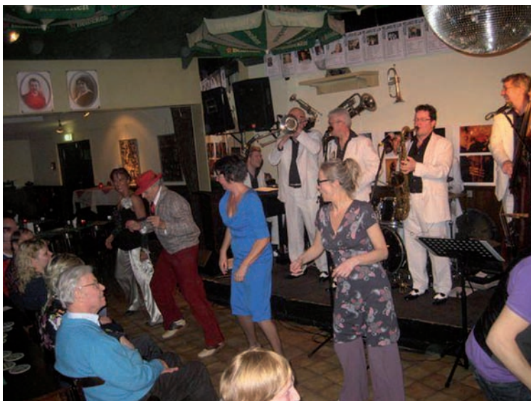
Jazz Connection in Langs de lijn op 12 februari 2012