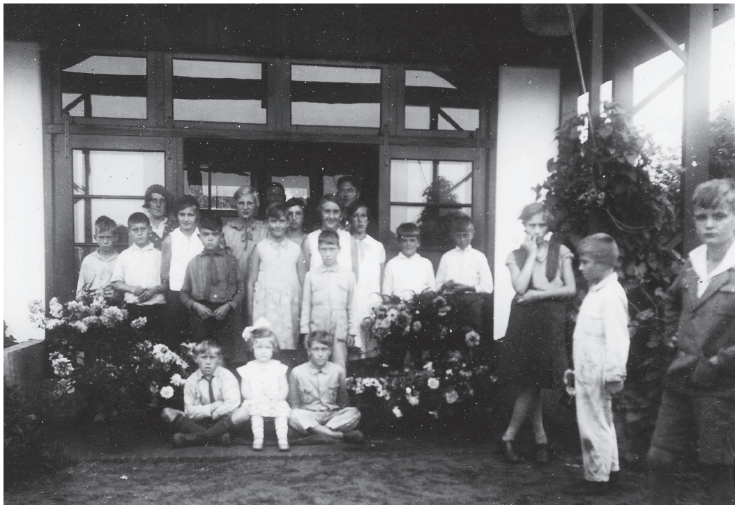
Groepsfoto's; datum onbekend