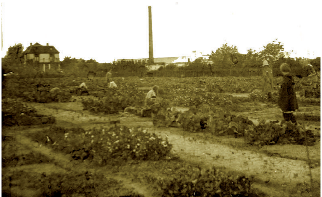
Aan het werk op de tuin aan de Hoofllaan