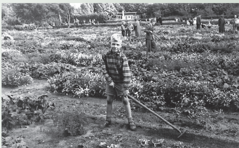
Een prominent lid van de HKB aan het werk in de jaren vijftig

genoeg niets wordt gezegd, was sprake van ‘schaarschte van diverse zaden, voornamelijk sperciebonen’. Van 1944 tot en met 1948 zijn er geen notulen. In het verslag van de Kring Noord-Holland van 1945 staat echter dat Bussum 165 leerlingen een tuintje kon geven en dat 140 leerlingen moesten worden teleurgesteld. In april 1945 bleek alle personeel ondergedoken te zijn, mest was niet verkrijgbaar, zaad aanvankelijk evenmin, zodat de kinderen ‘zonder leiding als