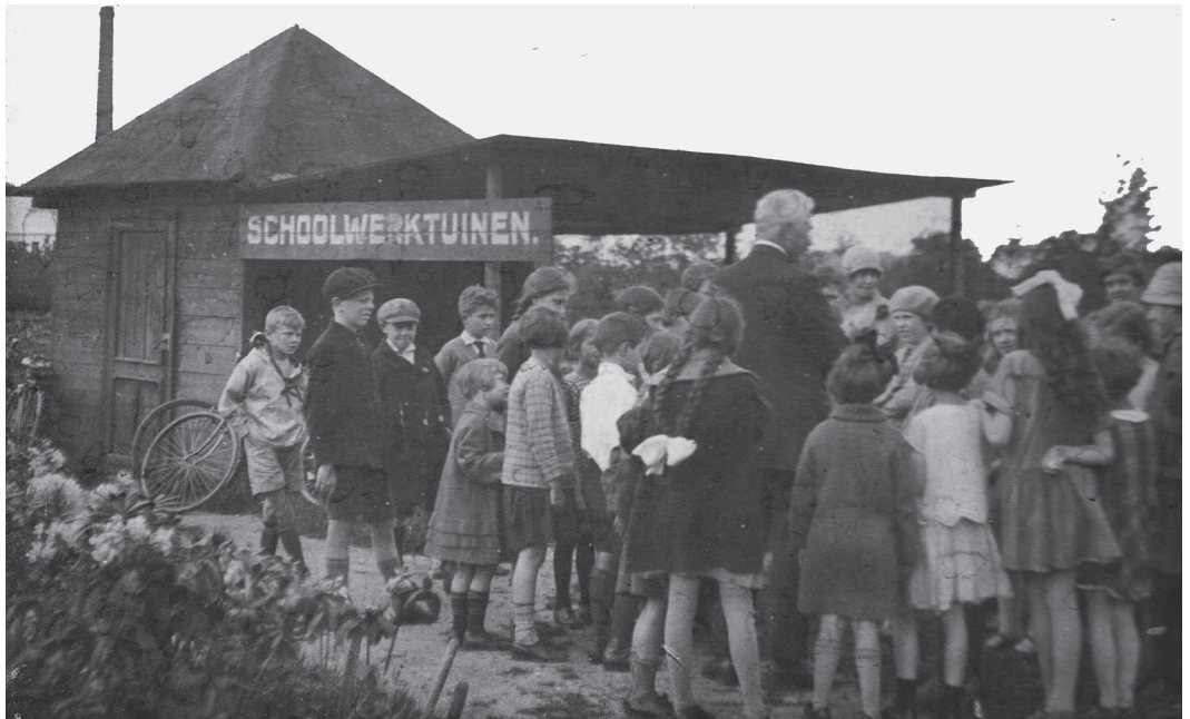
Onderricht op het terrein aan de Hoofllaan