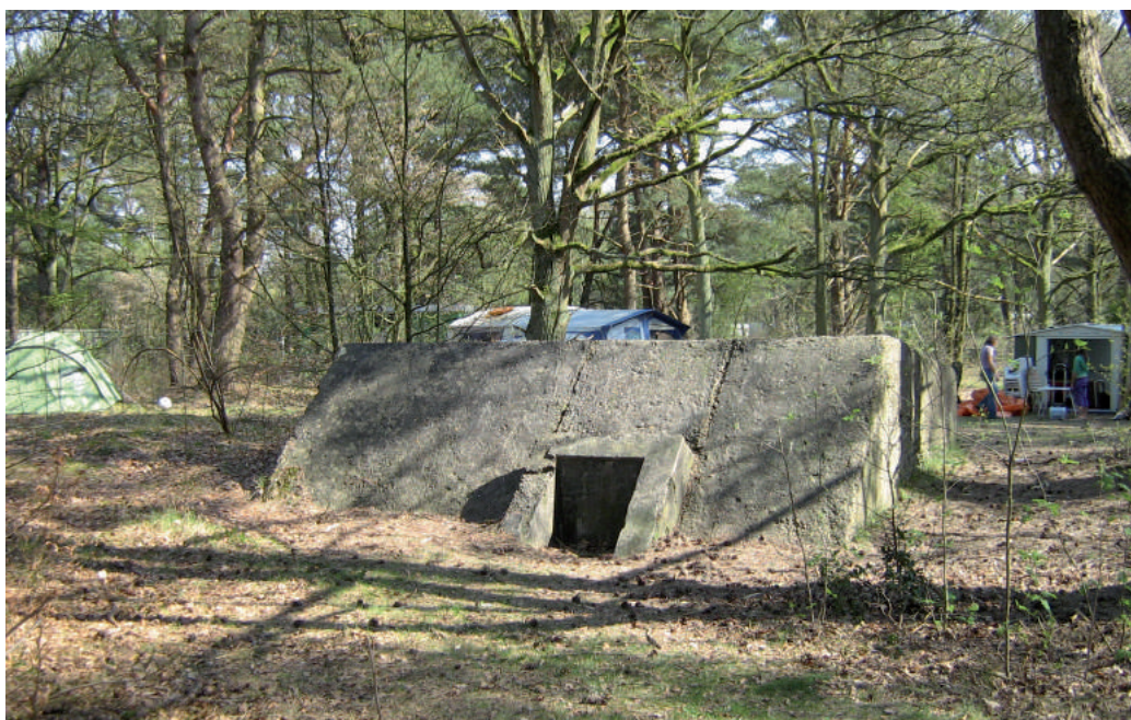
Een van de groeps- schuilplaatsen uit de Eerste Wereldoorlog

Toch was Europa niet alleen maar een slagveld. Het was en is ook een culturele en intellectuele gemeenschap, die teruggaat op de politieke en filosofische denkbeelden uit de Griekse