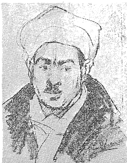
Met enkele vluchtige, rake lijnen heeft Ten Hoope deze kop weergegeven van een der vele types, die hij in de cafeetjes te Port Said opdook.