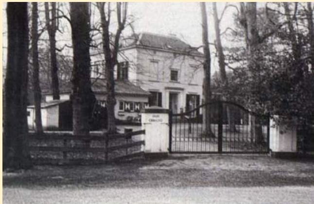
Toegangshek Landgoed Crailoo ca. 1900