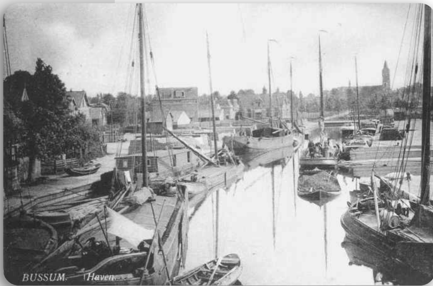
Haven met toren van de St. Vituskerk