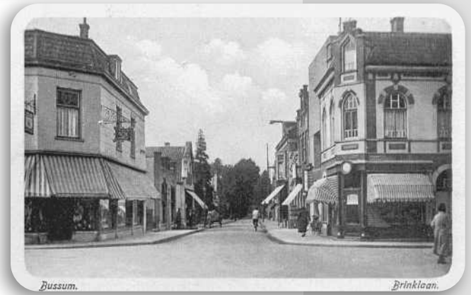
Brinklaan richting Naarden, links Nassaulaan, rechts Havenstraat