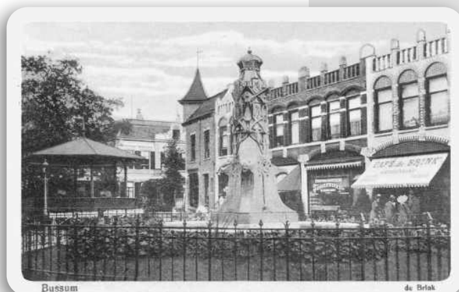
De Wilhelminafontein op de Brink

In de fontein is veel symboliek verwerkt, o.a. in de keuze van het hardstenen materiaal, de afsluiting met de kroon, de familiewapens van Oranjetelgen, Wilhelmina (ruitvorm), Bussum (vijf boekweitkorrels) en Holland (rode leeuw met blauwe tong, met stedenkroon).