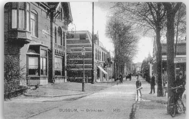
Brinklaan met rechts de Veerstraat, in de richting Havenstraat, rechts Café Delta, nu McDonalds, links nu de bibliotheek; in de verte slagerij Hogenbirk, op de hoek van de Veldweg