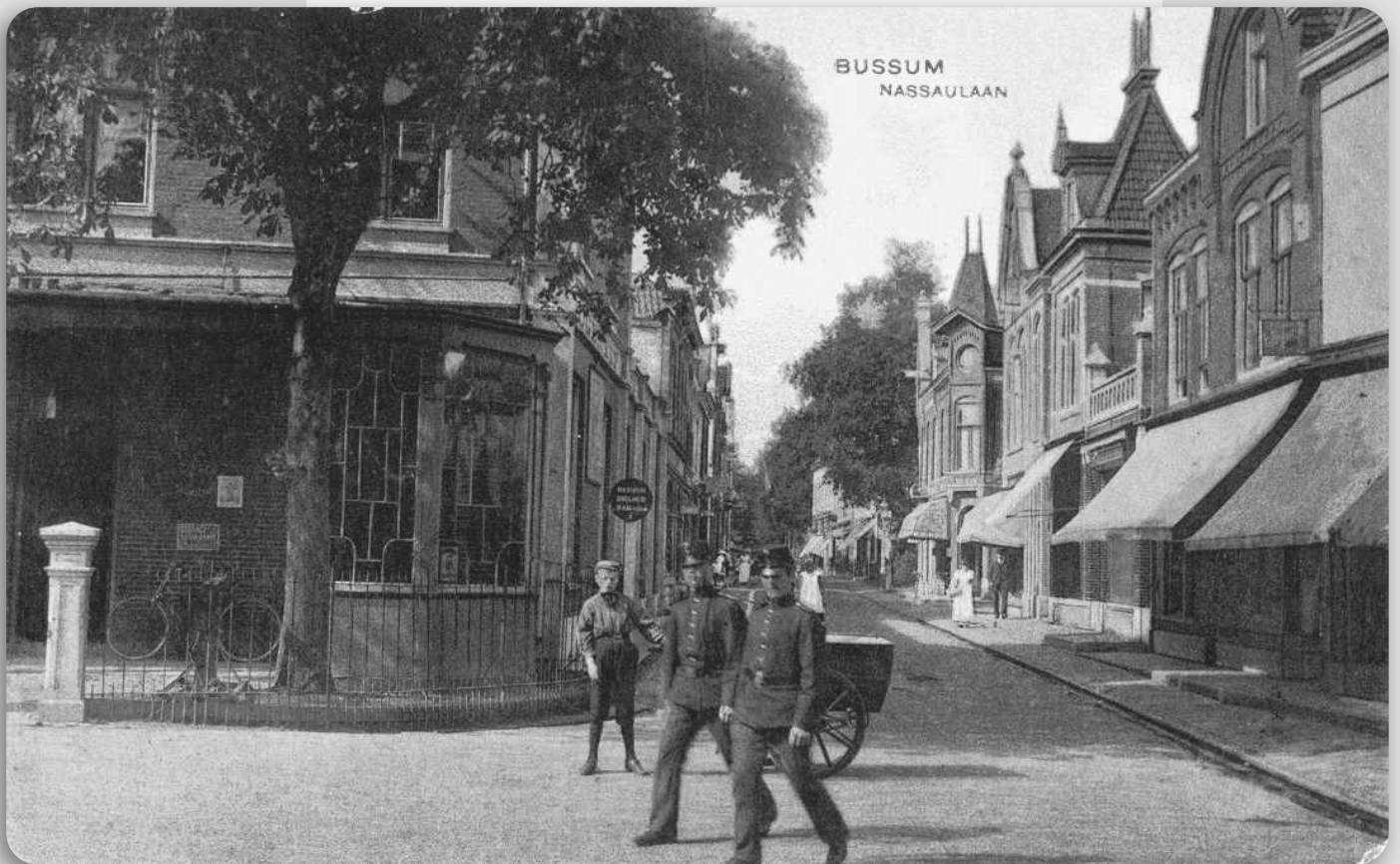
Nassaulaan, vanaf de Brinklaan