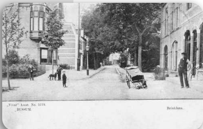
Brinklaan, rechts Veerstraat; de voormalige slijterij links brandde in 1984 af