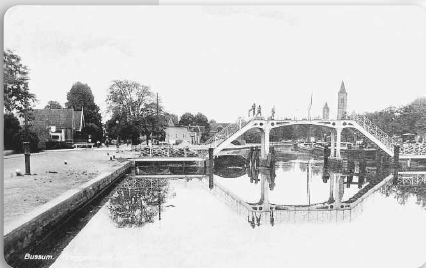
Haven met S.H. Veerbrug met op de achtergrond de torens van de St. Vituskerk en de Wilhelminakerk