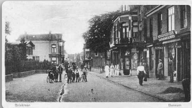
Brinklaan bij Nieuwe Brink richting Naarden; achter de hardstenen paaltjes rechts bevond zich het oude Raadhuis