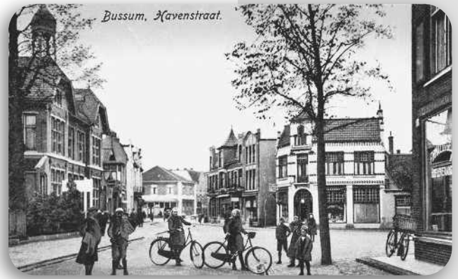
Havenstraat richting Brinklaan

In 1906 vestigden de Posterijen zich in de Havenstraat. De linkerhelft van het postkantoor deed dienst als ambtswoning. Na de opening van het nieuwe postkantoor aan de Huizerweg in 1933, werden de gemeentelijke afdelingen Burgerlijke Stand en Sociale Zaken ondergebracht in het oude postkantoor aan de Havenstraat. Het pand is gesloopt begin 60er jaren.