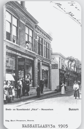
Nassaulaan 13a, het steegje rechts is de voormalige ingang naar villa Nassau

In 1906 vestigde zich er de N.V. Nederlandse Naamplaten- en Kunstmailleerfabriek v/h Keizer & Co. In 1912 breidt de fabriek uit en wijzigt haar naam in Verenigde Blikfabrieken. In 1929 vertrekt de fabriek naar Amsterdam-Noord. In deze periode wordt de villa langzamerhand geheel ingebouwd door omliggende panden.