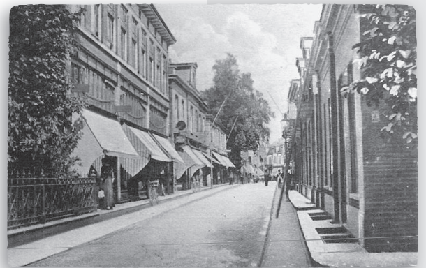
Nassaulaan richting Brinklaan, links het hek van Villa Stella, daarachter de melkfabriek, nu drogisterij Kruidvat

Lange tijd heeft de villa daarna leeggestaan, uiteindelijk is zij afgebroken in 1993. De locatie zal ongeveer geweest zijn ter plaatse van het parkeerterrein achter het huidige appartementengebouw 'Villa Nassau' aan de noordzijde van de Veldweg.