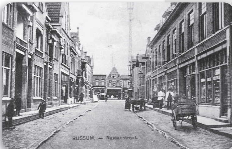
Nassaustraat, richting Nassaulaan; met aan het einde het pand van Blokker

In café Maison de Blanc, nu Hünkemöller, kwamen destijds de militairen uit Naarden biljarten.