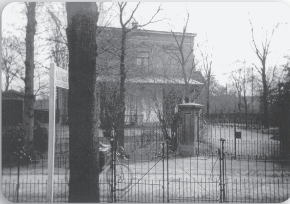
Villa Nassau, ingang aan de Nassaulaan