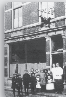
Nassaustraat 4, Maison Le Blanc; de eigenaar en zijn gezin