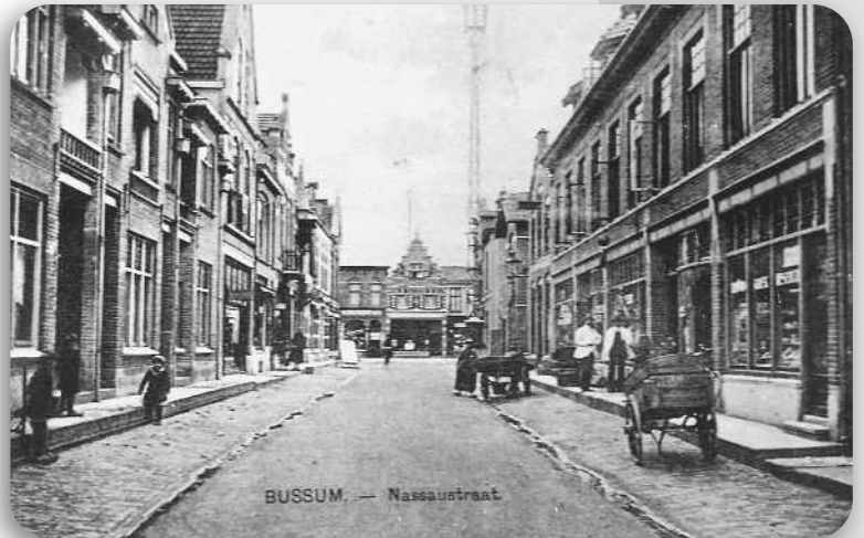
Nassaustraat, richting Nassaulaan; met aan het einde het pand van Blokker

In café Maison de Blanc, nu Hünkemöller, kwamen destijds de militairen uit Naarden biljarten.