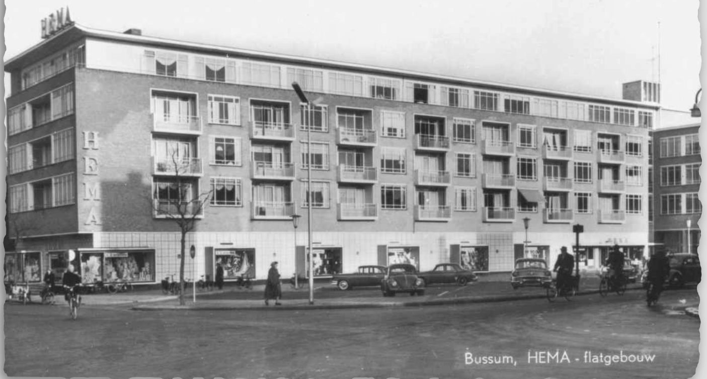
HEMA-gebouw met flats