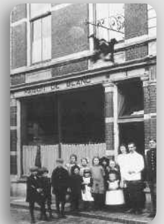
Nassaustraat 4, Maison Le Blanc; de eigenaar en zijn gezin