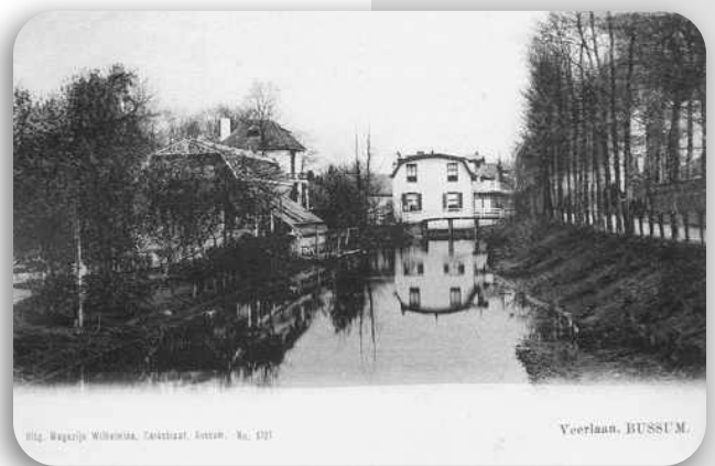
Veerstraat, vanaf de Vlietlaan richting Brinklaan

Langs de Veerstraat lag de Veersloot, deze diende o.a. als blusvoorziening en watervoorziening voor de aangelegen tuinen, werd ook gebruikt om de was te doen; 's winters werd er graag op geschaatst. In de hoge witte villa op de foto woonde de bekende fotograaf Coenraad Verschuur. Rechts is het hek van Villa Delta zichtbaar.