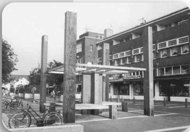
Ruimtelijk object van Coen Wilderom (Bloemendaal, 1944)

Het Julianaplein is een aantal malen gerenoveerd, bij de renovatie in 1993 is een in 1987 geplaatst object van Coen Wilderom, vervangen door 'De Waterbak' van Jits Bakker (Renkum, 1937).