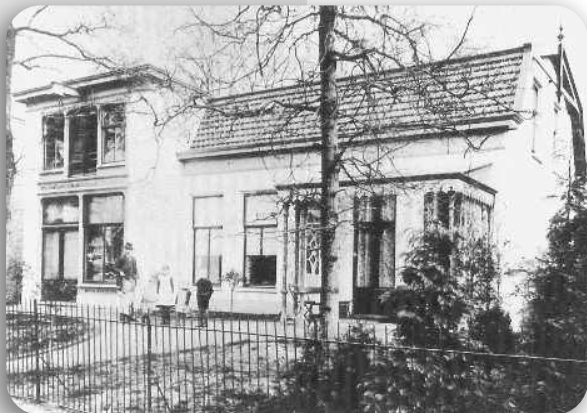
Nassaulaan 18, familie Bouwman

In de Nassaulaan zijn nog sporen van het verleden te vinden. De ingang op 17a is de voormalige ingang van Villa Nassau.