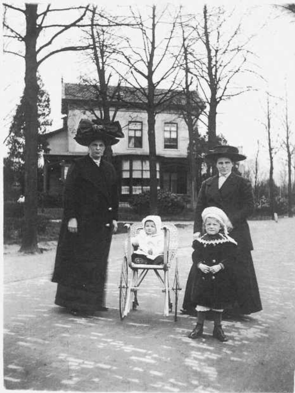
Villa Louise, Vlietlaan hoek Eslaan

stond Villa Corrie. Achter in het tweede steegje staat nog het voormalige koetshuis van Villa Corrie, nu in gebruik als garage. Daarna volgde Villa Cornelishove, gebouwd in 1880. Dit huis heette later Villa 'De Riepel' en vanaf 1907 Pension 'Benvenuta'. Het koetshuis ervan bestaat nog, is ingrijpend verbouwd en ligt aan de Eslaan 5.