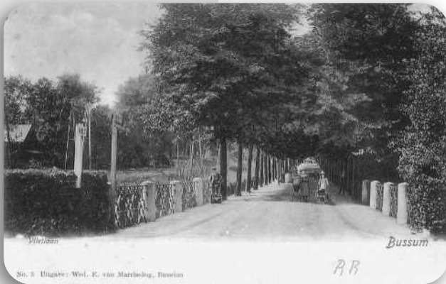
Vlietlaan richting station, met het bruggetje over de Veersloot, 1908

Naast Benjamin Franklin stond Villa Willem Tell (1879). De villa werd enige jaren bewoond door W.C. van Vliet. Wiggers de Vries, een van de latere eigenaren, bouwde in 1913 in zijn voortuin het theater 'Novum' annex café-restaurant 'De nieuwe Karseboom'. In 1917 brandde het theatercomplex af. Na de herbouw werd in de bovenzaal en de tuin van 'Novum' de Fröbelinrichting 'De Kindertuin' gevestigd, tot 1920. Vermoedelijk bleef de villa min of meer in gebruik door bewoners die iets met Novum te maken hadden, zoals een uit Berlijn afkomstige filmopereater. Door