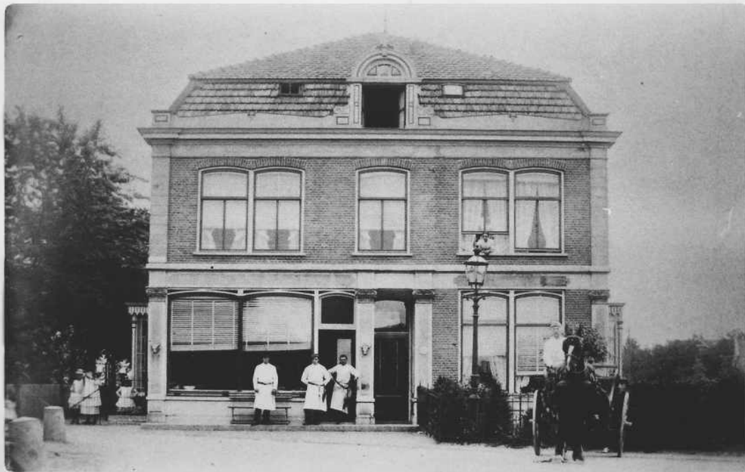
Slagerij J.S. Keppler