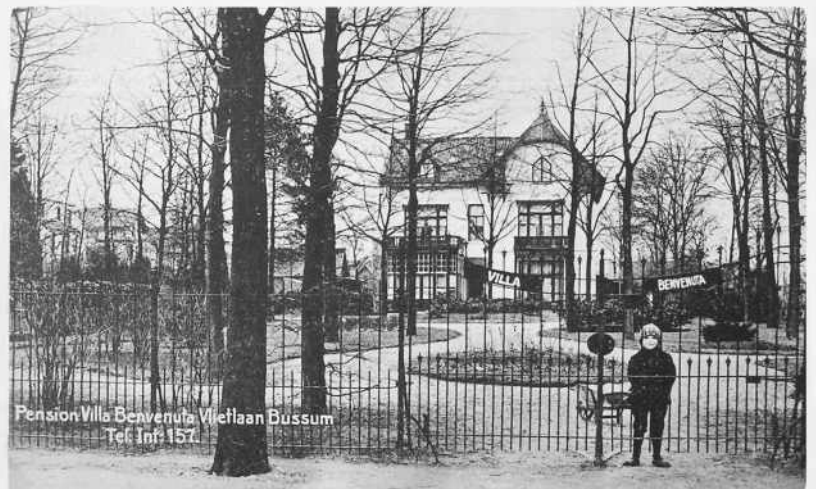
Villa Cornelishove, later Pension Benvenuta