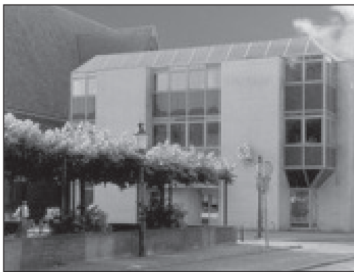
Centrale bibliotheek aan het Wilhelminaplantsoen 18 te Bussum.

Dit betekent dat de huidige spreiding van de bibliotheekvoorziening over drie vestigingen, Bussum-centrum, Bussum-Zuid en Naarden, al 84 jaar van kracht is. In de loop van de jaren hebben zich ook de katholieke bibliotheken, dr. Schaepman in Bussum en St. Vitus in Naarden, bij de openbare leeszaal en bibliotheek aangesloten, met als resultaat de huidige Stichting Openbare Bibliotheek Naarden-Bussum, die vanaf 1979 het bibliotheekwerk onder haar hoede heeft.