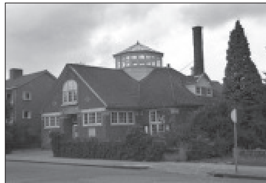
De "oude" bibliotheek aan de Generaal de la Reijlaan, Bussum.

Openbare Leeszaal en Bibliotheek te Naarden-Bussum' werd een NV opgericht die aan het werk ging om het kapitaal te generen dat nodig was voor het realiseren van het bibliotheekgebouw. Aan de Generaal de la Reijlaan werd in 1912 een stuk grond van 1900 m 2 gekocht en op 21 april 1914 werd op nummer 12 de daar gebouwde leeszaal en bibliotheek geopend. Een uniek gebouw, dat nooit verloren mag gaan, want het is het eerste in Nederland als openbare leeszaal en bibliotheek ontworpen en gebouwde gebouw.