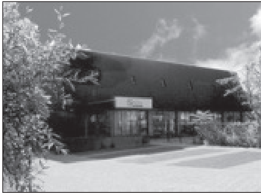
Filiaal Naarden aan de Van Limburg Stirumlaan 2 te Naarden.