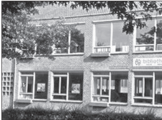
Filiaal Uit-Wijk aan de Ceintuurbaan 47 A. te Bussum.