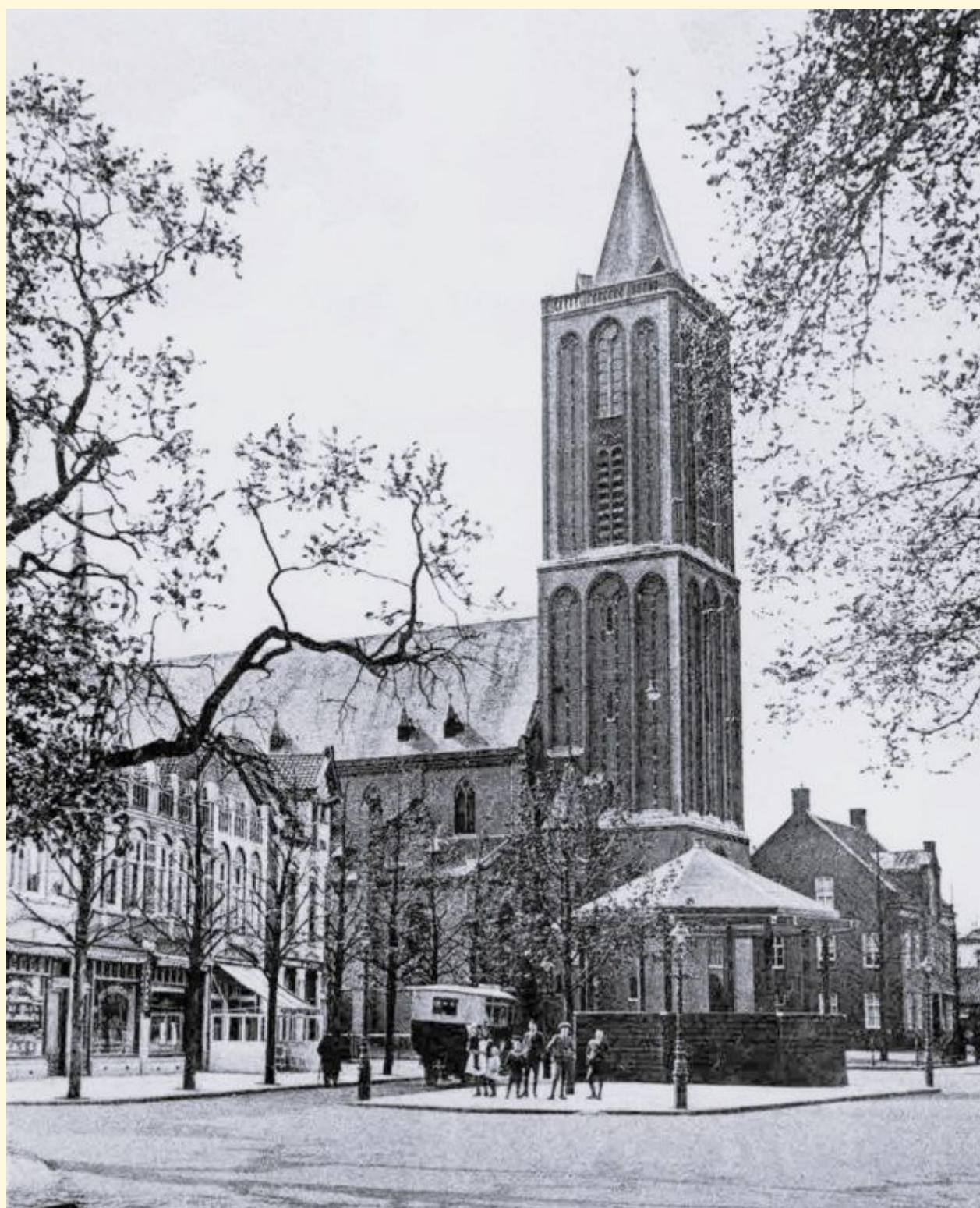
De Brink omstreeks 1930