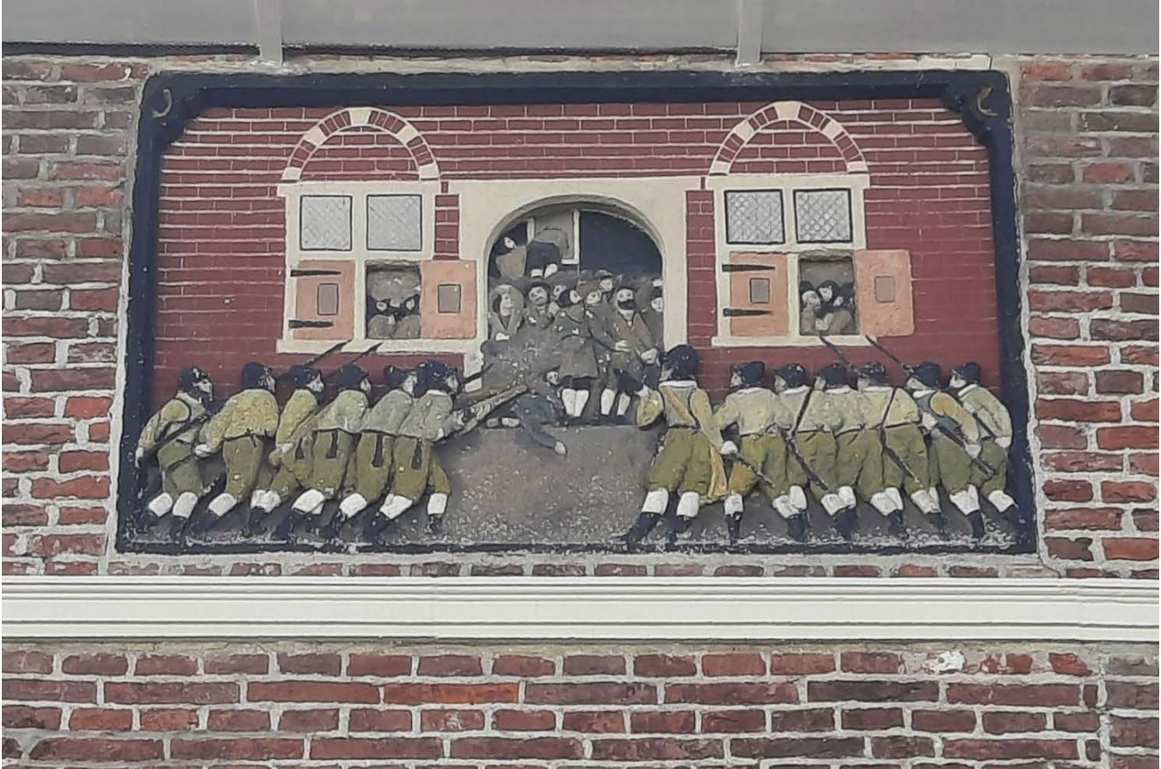
Gevelsteen in het voormalige stadhuis (Spaanse huis) in Naarden.