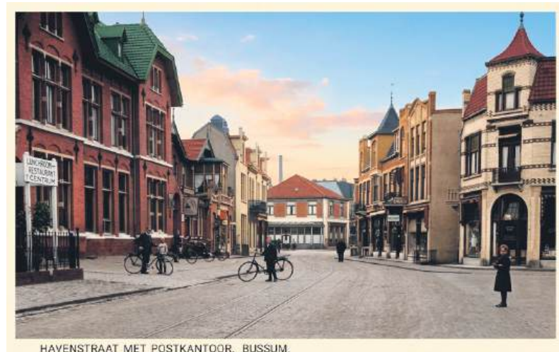
■ Geheel rechts Havenstraat 13.