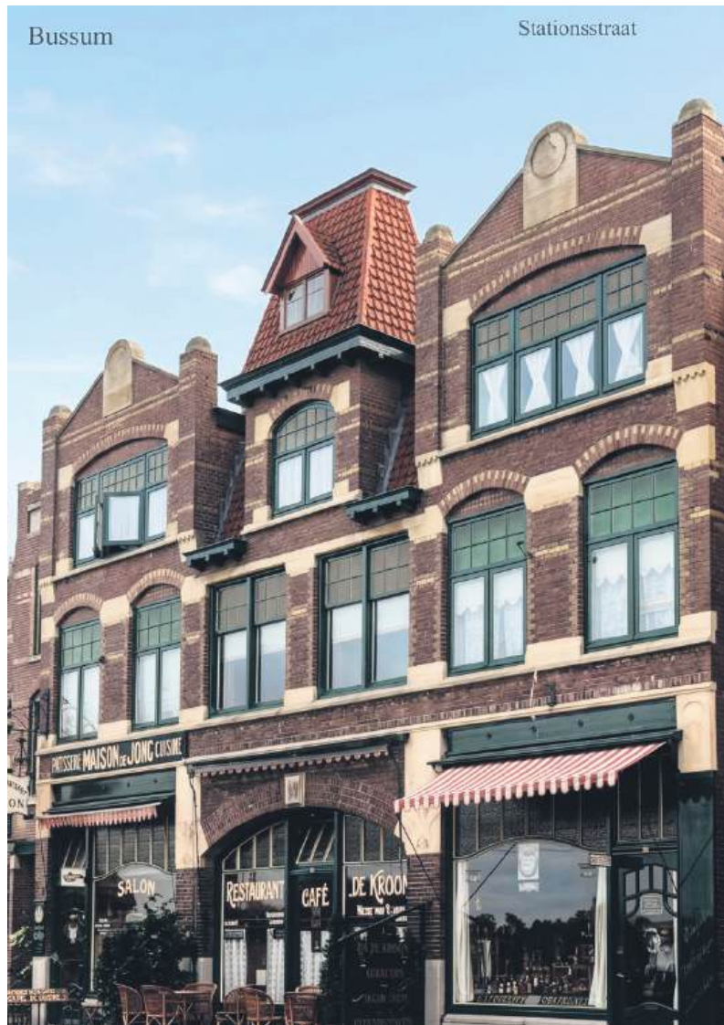
■ Stationsweg 10 t/m 14 uit 1907, gefotografeerd in 1915.

(Miriam is een achternichte van Willem: hij was de oudere broer van haar grootvader. Miriam woont in Australië.)