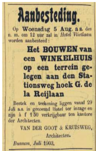
■ Bussumsche Courant 25-07-1903.